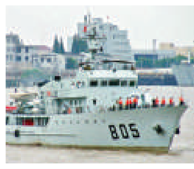
▲ 掃雷艦 資料圖片