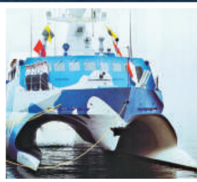
▲ 022 型導彈快艇 資料圖片