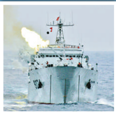
▲ 登陸艦 資料圖片

根據公開資料，在北京地區註冊的與谷歌中國有關的公司共四家：北京谷翔信息技術有限公司（合資公司）、谷歌信息技術（中國）有限公司（外國法人獨資）、雙擊軟件技術方案（北京）有限公司（外國法人獨資）、咕果信息技術（上海）有限公司（北京分公司）。谷歌內部人士透露，上述四家公司均已通過2009年企業年檢。