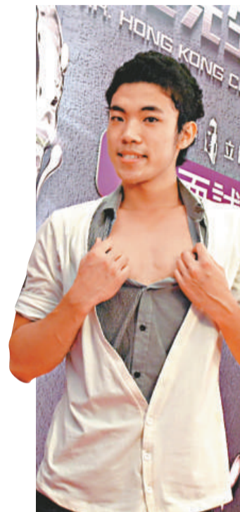
▲「港版歷蘇」主動解開衫鈕騷胸肌