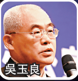
中央紀委常委、秘書長