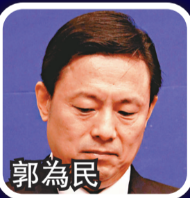
中央外宣辦新聞局局長