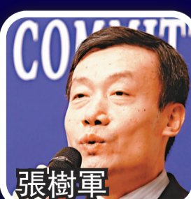
中央檔案館政策法規司司長