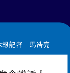
中央文獻研究室室務委員、秘書長