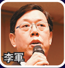
中聯部研究室主任