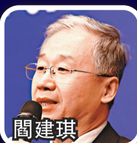
中央黨史研究室室務委員、秘書長