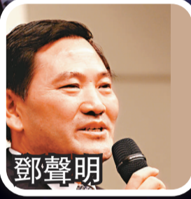
中組部秘書長兼辦公廳主任