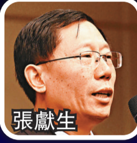
中央統戰部研究室主任