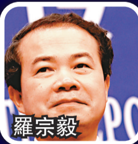
中央黨校校委委員、辦公廳主任