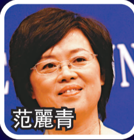
中央台辦新聞局副局長