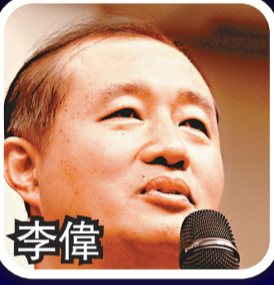
中宣部副秘書長、全國宣傳幹部學院常務副院長