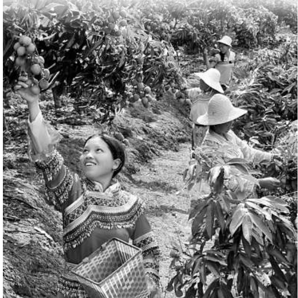
屏邊妃子笑荔枝以果大、核小、口感好而享譽雲南省內外

據有關資料介紹，妃子笑盛產於廣東、廣西、海南、台灣和四川等地。屏邊妃子笑為何享譽盛名，成了絕品呢？1998年，屏邊組織人員到廣東、廣西等地考察妃子笑的種植情況，最後得出結論：屏邊更適宜種植荔枝中的優質品種妃子笑。1999年初，屏邊縣採取「公司+農戶」的