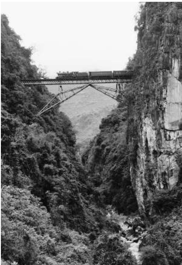
享譽世界的滇越鐵路人字橋

崇崇高山、巍巍壁崖，滇越鐵路的標誌性工程——人字橋，彷彿一個頂天立地的巨人，展開雙臂，推開雙嶺，叉開雙腿，橫跨在屏邊四岔河峽谷之間。這一世界鐵路橋樑史上傳世經典，歷經百年，依然以超凡脫俗的獨特美學價值贏得各方讚許。滇越鐵路與巴拿馬運河、蘇伊士運河並稱為世界三大工程。