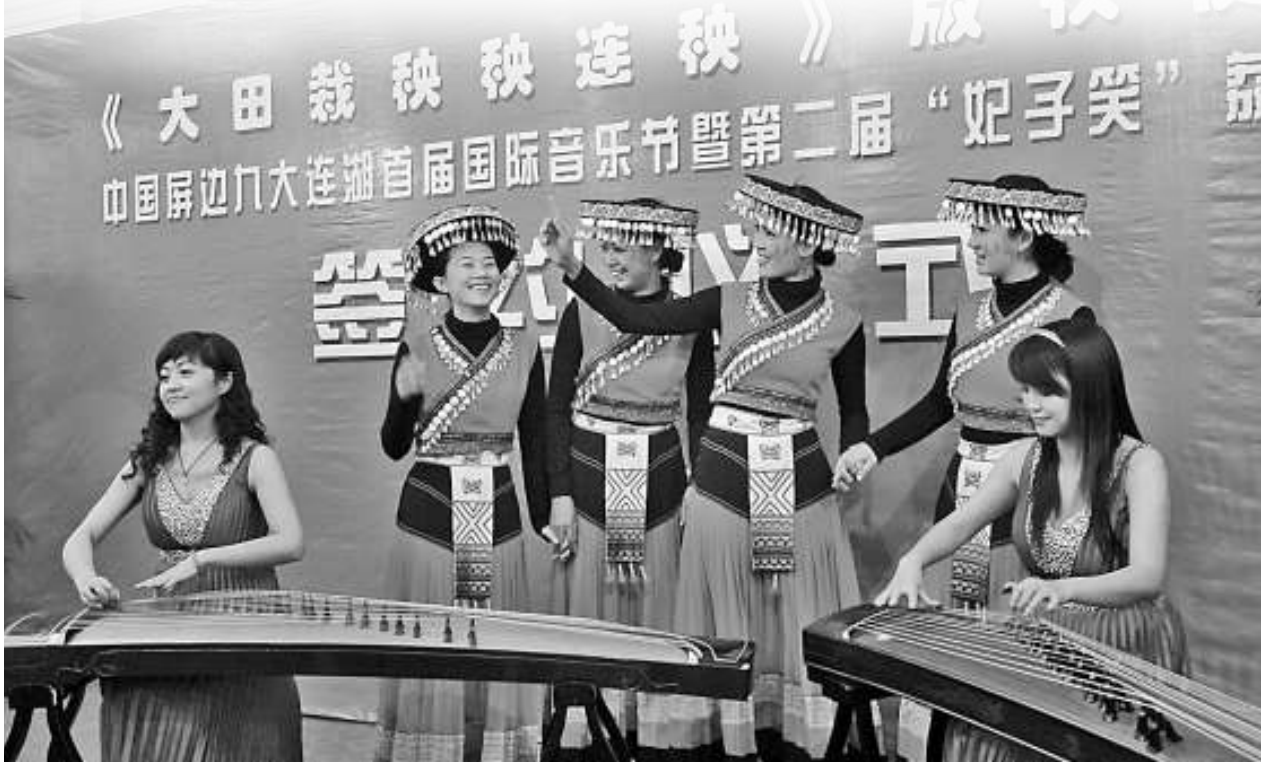
幾位身穿民族服裝的屏邊姑娘在演唱《小河淌水》的原曲《大田栽秧秧連秧》

這裡是小河淌水的源頭，這裡是大田栽秧的故鄉。15萬熱情好客的屏邊人民邀請您一同來品嚐「妃子笑」荔枝，遊玩大圍山、人字橋，欣賞苗嶺古韻，領略苗嶺風情。