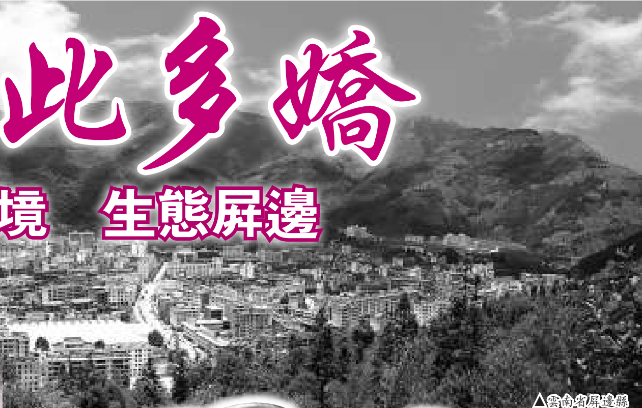
△雲南省屏邊縣 縣城全貌

屏邊，一顆滇南明珠，是雲南省唯一的苗族自治縣，全國5個苗族自治縣之一。地處雲南省南部，紅河州東南部，處於中越國際大通道的咽喉部位。境內旅遊資源豐富，有距昆明最近的原始森林大圍山國家級自然保護區、世界最大天然睡佛、國內罕見的史前陸地火山、景致迷人的高山瀑布、舉世矚目的滇越鐵路和人字橋，被譽為「動植物基因庫」、「天然美容院」和中國最南端的春城。隨着昆河高速公路蒙自至河口段、蒙自至石林段的即將通車，屏邊的區位優勢將更加凸顯。目前，屏邊處在「昆明—河口—越南」國家黃金旅遊線路的「光接點」上，依託昆明、河內國內外旅遊市場客源的對流互動，屏邊必將成為吸引域外遊客的新視點，成為距昆明、河內最近的避暑度假休閒體驗勝地，昆明、河內也將成為屏邊休閒度假旅遊最重要的客源依託地和橋頭堡。