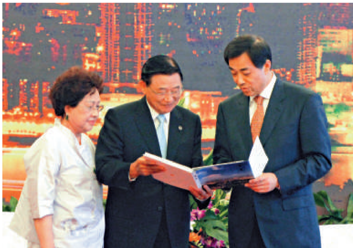
▲薄熙來（右）昨日向江丙坤（中）贈送重慶風光畫冊，並朗誦他親筆題上的詩詞。左為江丙坤夫人陳美惠

現場的氛圍也讓江丙坤活躍起來，他先說一句：「很多人都說薄書記很綠。」然後刻意停頓下來，由於台灣朝野分藍綠陣營，江丙坤此言一出，立刻引起全場哄笑。江丙坤解釋說，因為去年一年重慶投下一百三十七億人民幣種樹，去年一年就超過過去十年植樹的紀錄，所以他這次來到重慶，看到重慶比去年大大綠化了。江丙坤透露，薄書記曾經表達希望兩會會談在重慶