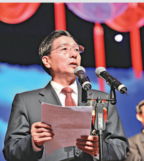
▲廣西壯族自治區黨委書記郭聲琨今將率團赴台