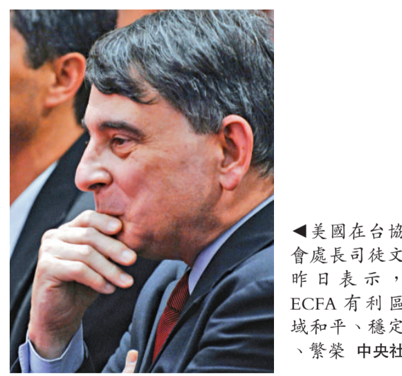
▲美國在台協會處長司徒文昨日表示，ECFA 有利區域和平、穩定、繁榮

該文認為，台灣成為區域樞紐的潛力不容置疑，這個小島具有天然的地理優勢、成熟的勞動力和靈活的企業家。台灣可以藉著推動更多自由市場改革提高台灣的區域競爭力，藉此鞏固多年自由貿易成果。