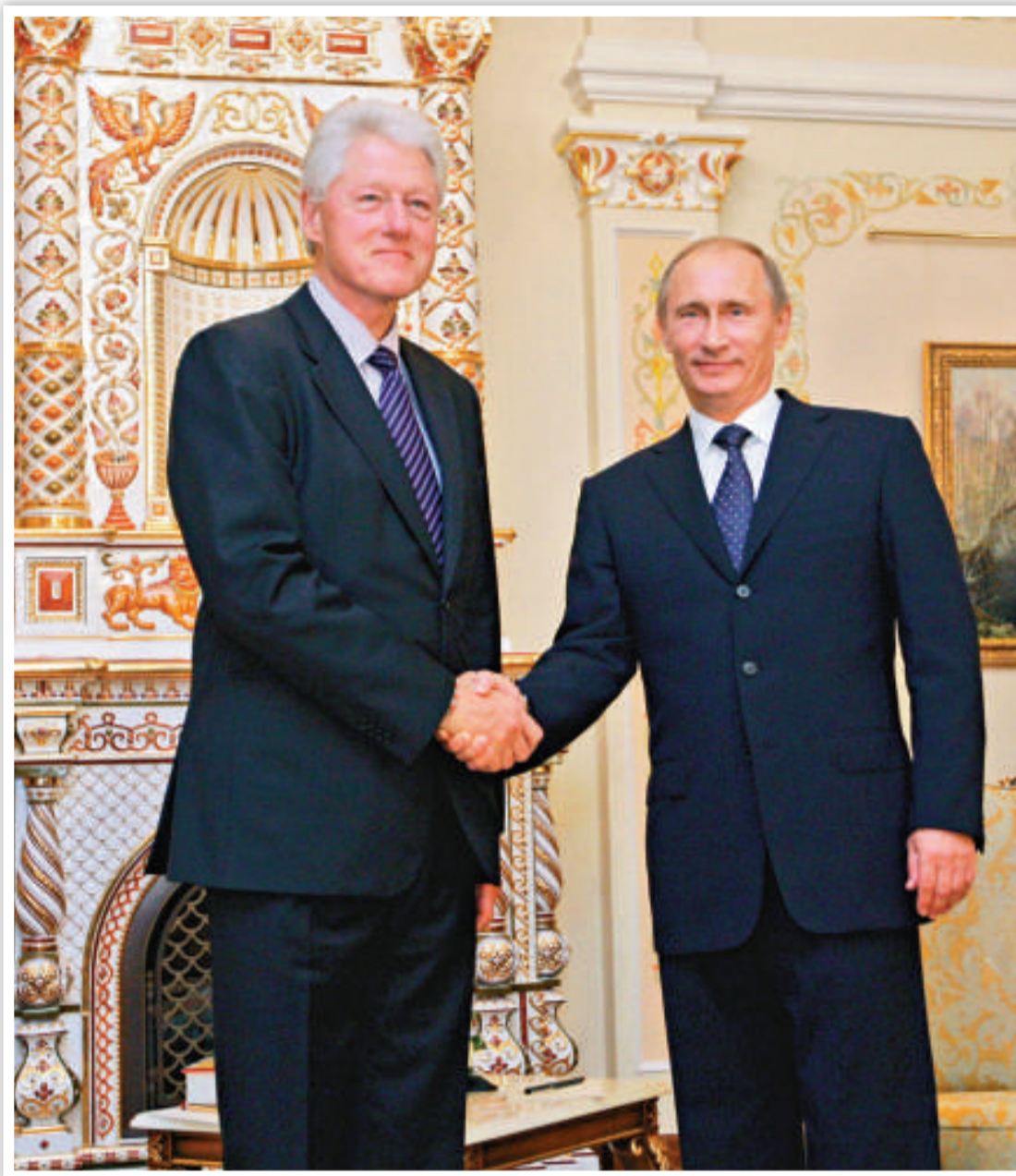
▲俄羅斯總理普京(右)29日在莫斯科會晤美國前總統克林頓

29日，俄外交部發言人涅斯捷捷科發表聲明指，被美方逮捕並被控充當俄羅斯間諜的俄羅斯公民