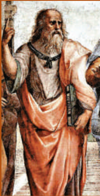
▲拉斐爾畫作《雅典學院》中的柏拉圖 互聯網