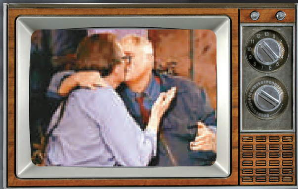
▲拉里金在節目中被已故影星馬龍白蘭度濕吻，成為經典一幕