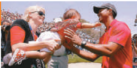
▲二人離婚後，「老虎」活士的妻子艾琳（左）將擁有兒子的監護權

物業方面，歸艾琳所有的將會是兩人最主要的住宅（位於佛羅里達州）、鄰近的一幢物業（加起來值300萬英鎊）、一幢位於瑞典斯德哥爾摩的住宅，以及附近一個島上的農莊。活士則可保留5000萬