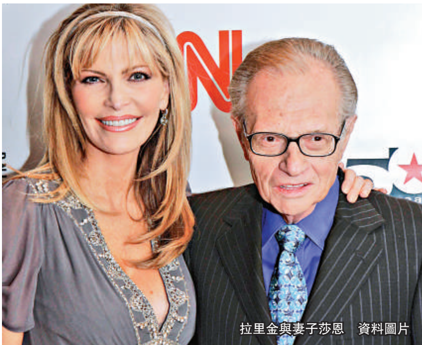
拉里金與妻子莎恩 資料圖片