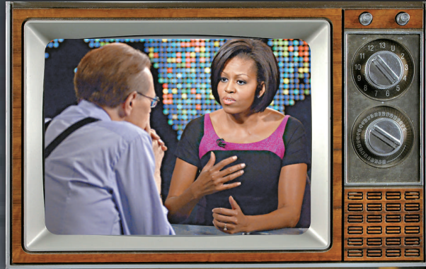
▲拉里金與美國第一夫人米歇爾訪談