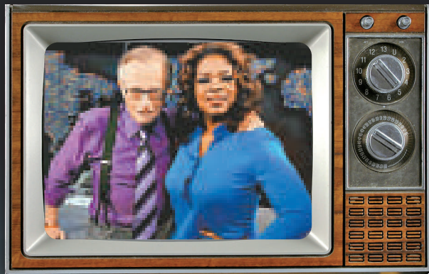
▲「清談教父」拉里金與「清談女王」奧花雲費均表示將結束自己原有的節目 互聯網