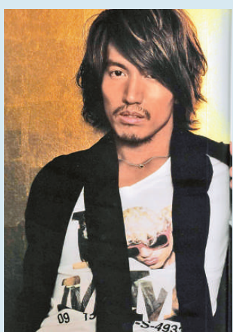
◀言承旭早前到日本宣傳寫真集，收到不少 fans 送的禮物

而七月中言承旭會到內地和香港展開宣傳，為在港播出的《就想賴着你》宣傳，七月二十四日更會出席於香港愉景新城舉行的劇集首播會，之後又再風塵僕僕的趕到北京繼續宣傳工作。言承旭的寫真集內地版亦有很好的反應，大會特別抽出十位幸運 fans，稍後會獲言承旭親自致電答謝。