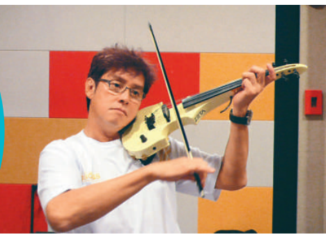
◀林文龍大談湊女經，又大讚可盈母愛豐富