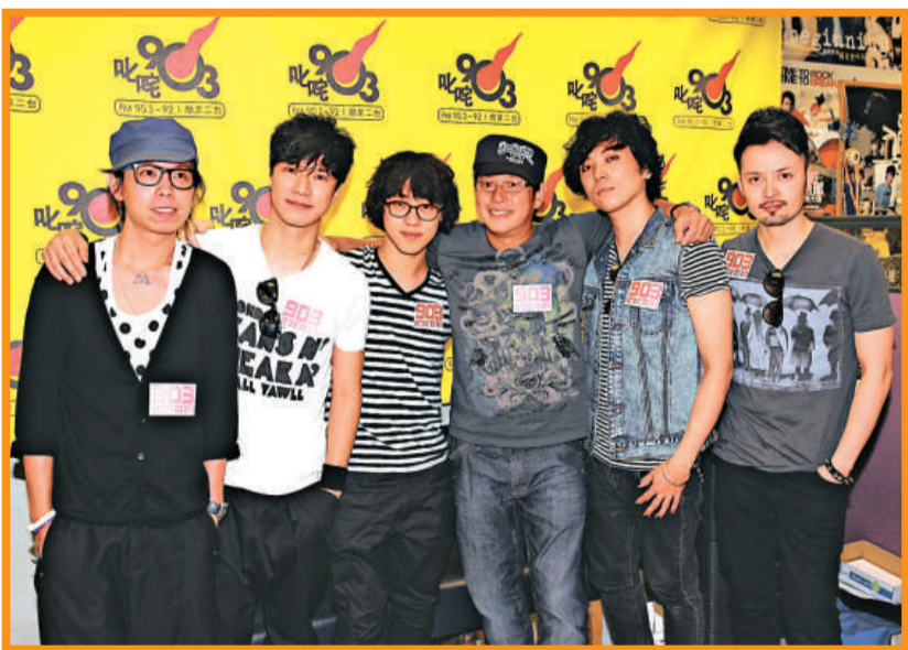
▲阿倫（左四）與MR.合作，他表示要與年輕人融為一體

另外，MR.今年書展亦會出書，書中會有相片及文字，他們覺得音樂不止是聽，其實透過書也可以享受音樂。問他們可以入書展嗎？MR.笑言可以，因為他們沒有「事業線」，只有眼線，就算有也不懂夾出來。