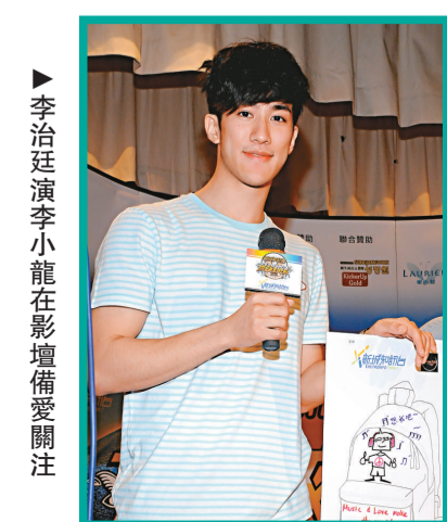
▲李治廷演李小龍在影壇備受關注

李治廷及Mr.昨日齊到新城知訊台「飛躍校園2010」活動，會上各人向學生分享追尋夢想的經驗，亦即場獻唱為學生們打氣。一眾歌手在欣賞學生的天才表演後給予評語。