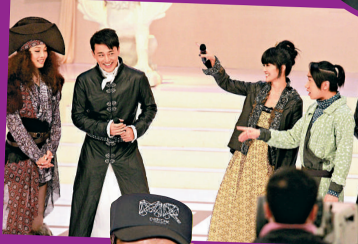
▲容祖兒（左起）、林峯、阿Sa、王祖藍合作愉快