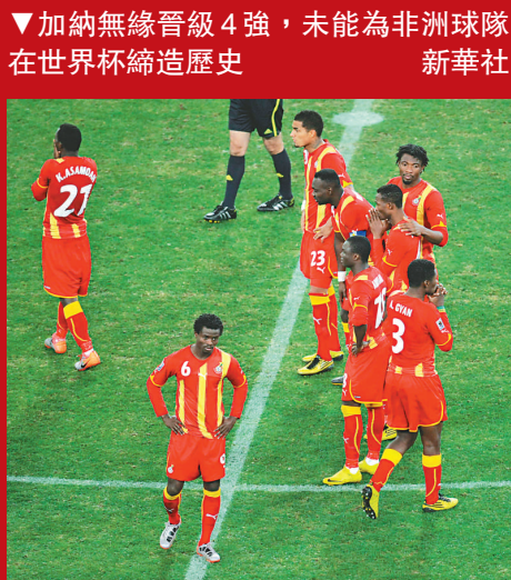
▼加納無緣晉級 4 強，未能為非洲球隊在世界杯締造歷史 新華社