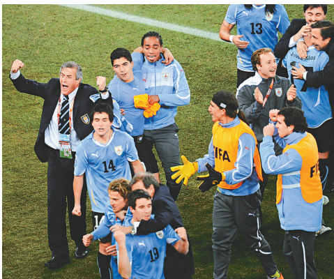
▲烏拉圭主帥泰巴尼斯（左）高度讚揚旗下球員

【本報訊】綜合外電三日消息：成功躋身 4 強之後，烏拉圭主帥泰巴尼斯坦言是始料未及，他說：「我們來到南非時，沒有想過能取得如今的成績。」