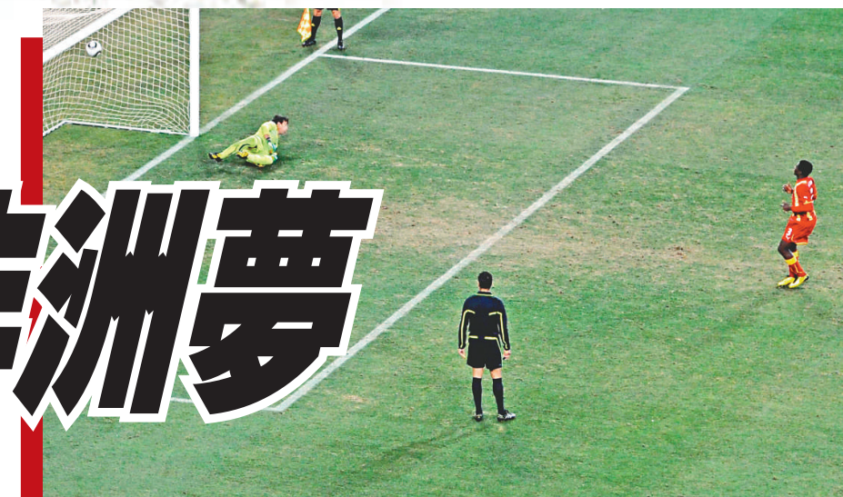
▲加納前鋒基恩（右）主射 12 碼中橫不入，直接令球隊最終出局

荷蘭對巴西之戰的過程峰迴路轉。上半場，巴西一開始就顯示他們的決心與實力，1 次前線球員的配合，羅賓奴在隊友引開荷蘭一對中堅下，高速切入中路的空檔接應菲臘比美路恰到好處的直線傳送，第 1 時間推射破門，入球過程充滿「森巴風味」。上半場，巴西防禦洛賓奴做得非常之好，洛賓奴每次推到禁區附近都發現左腳射門、推進都行不通，結果荷蘭連連擊之力都沒有，巴西在中場搶奪後發動的反擊則非常悅目，可惜入不了第 2 球，為輸波埋下了伏線。