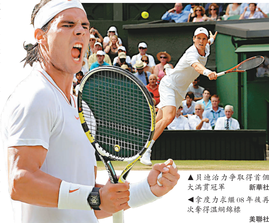
▲貝迪治力爭取得首個大滿貫冠軍 ▲拿度力求繼08年後再次奪得溫網錦標

昨晚的女單決賽，衛冕冠軍、美國名將「細威」莎蓮娜威廉斯在66分鐘的比賽中牢牢壓制住了俄羅斯的施雲娜莉娃。表現兇猛的「細威」首盤第8局取得關鍵的「破發」，然後在第9局第3次獲得盤點下取勝。第2盤「細威」再破掉對方第1、第3個發球局以5：1領先，施雲娜莉娃追回1局後，「細威」在自己的發球局中向對方「派蛋」，以6：2拿下次盤從而贏下整場比賽，如願拿到了自己的第4座溫網女單冠軍獎杯。