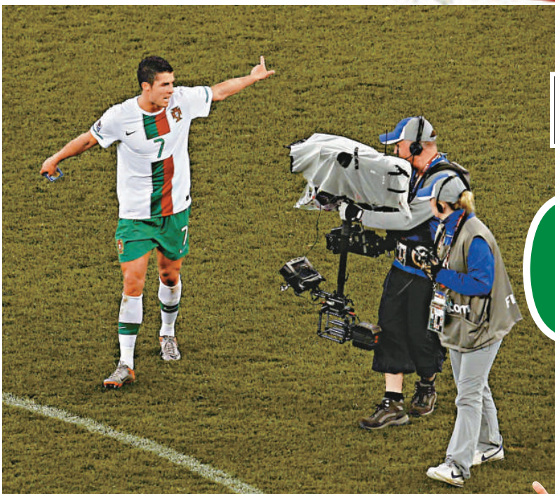
▲C朗拿度（左）在出局後公然向攝影機鏡頭吐口水，最終要承受惡果 ▲般奴艾維斯有望接任葡萄牙隊長