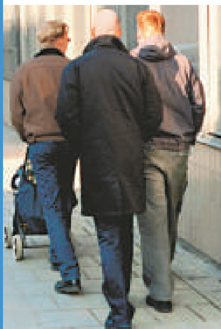
▲休「父親假」的瑞典爸爸們常在一起交流育兒經驗