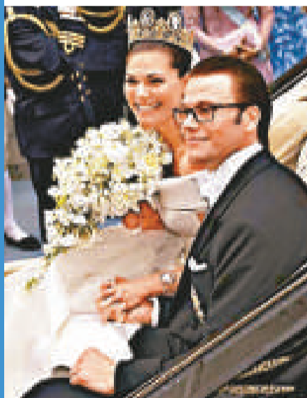
▲瑞典高度重視男女平等，未來女王、維多利亞公主6月19日大婚時，不由父親帶領，而是和新郎一起步入教堂，以示新娘自願嫁給新郎及兩人地位平等