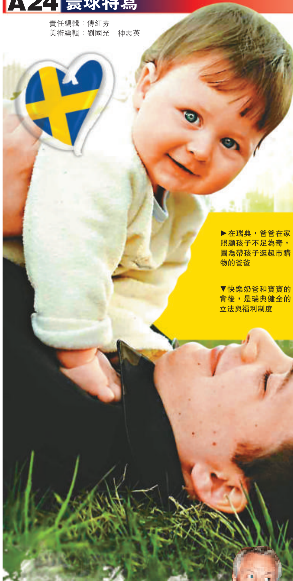
▶在瑞典，爸爸在家照顧孩子不足為奇，圖為帶孩子逛超市購物的爸爸