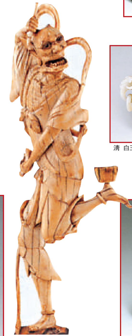
明 象牙雕魁星 高27cm