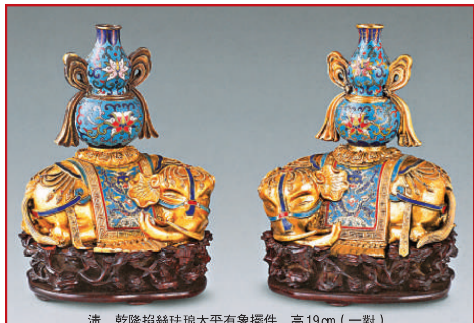
清 乾隆掐絲琺瑯太平有象擺件 高19cm (一對)