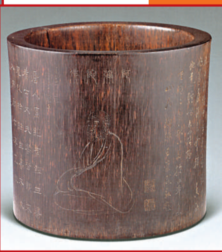
明 丁雲鵬畫人物詩文大筆海 高26.5cm