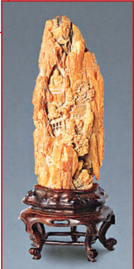
清初 江春波雕溪山行旅圖犀角山子 高24cm