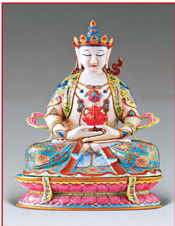
清乾隆 粉彩坐相無量佛 高39cm

集田黃、芙蓉、雞血等名品。刻手有王福厂、方介堪、沈覺初諸家，或摹刻古璽漢印，遵從傳統，或標新立異，自出胸臆。此次整體推出，風格多樣，洋洋大觀，是晚清民國乃至近代印藝的一面鏡子。