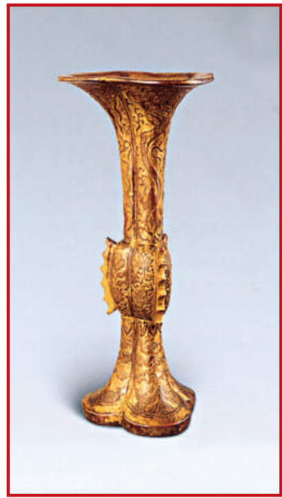
明 鑲金刻花蕉葉紋出戟花瓶 高24cm