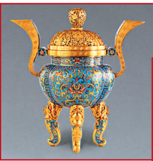
清乾隆 景泰藍海棠式四足爐 高34cm

作為此畫瓷器古玩專場的補充，還設立另外兩個專場，分別為「馨屋文齋集」及「印石精品」。前者80餘件，係日本及海外回流文物，亦以文房雅玩為主。此專場集竹木牙角雕刻，鑲金珠琅銅器於一爐，堪稱日本及其他海外回流之珍品，以「清犀角花紋擺件」、「清犀角花紋杯」為代表，令人過目難忘。後者係壽山石雕印石、昌化雞血、福建田黃精品。論印材，包括善伯洞石、荔枝洞石、水洞高山石、芙蓉石等名品，品種豐富；論工藝，其石印鈕及薄意雕亦不乏名手雕刻，審石度勢，費心精刻，可謂質、色、工俱佳，極盡福建壽山石之美。