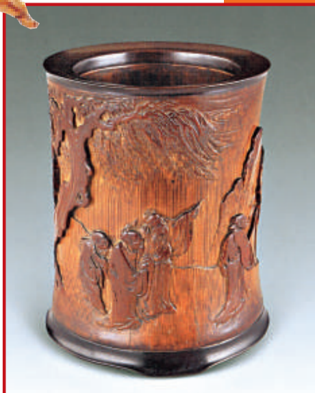
清 竹刻人物筆筒 高14cm