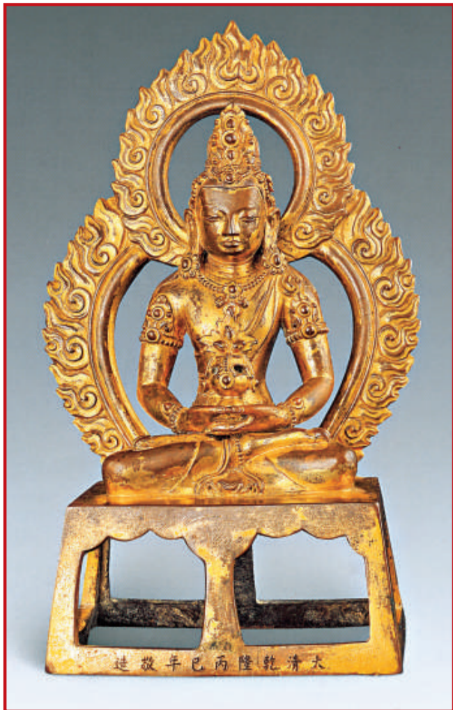
清乾隆 鑲金漢藏佛像 高20cm

中國古代文具，其工藝，其製作，源遠流長，深韻無窮。傳統文房用品以筆、墨、紙、硯為主，兼佐筆筒、筆架、筆洗、臂擱、紙鎮、硯山、硯滴等，乃至書架上供石古器的陳設，都是文房雅玩的範疇。