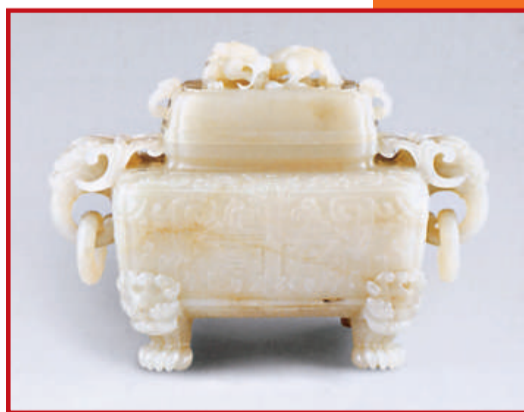
清 白玉雙龍耳四方爐 11 x 18cm