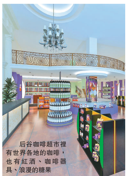
后谷咖啡超市裡有世界各地的咖啡，也有紅酒、咖啡器具、浪漫的糖果

熊相入說咖啡超市投資風險小，不收取任何加盟費，50萬的裝修費用由后谷承擔，並且採取1比1的配貨模式，最大