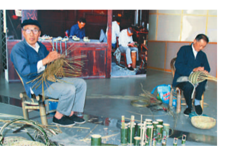
來自周莊的原住民在現場展示竹編工藝

作爲中國古鎮保護與發展最爲成功的典型，「水[洗]」出來的詩畫水鄉「周莊」周莊案列展示活動近期在上海世博園開幕，中外遊客在世博園內就可以近距離感受到千年古鎮周莊秀美婉約的水鄉風光和清新雅緻的小橋流水人家生活。