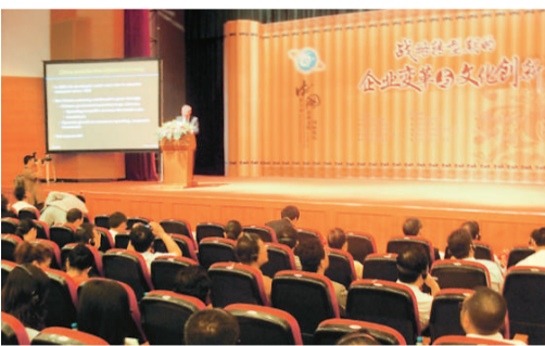
中國企業文化國際論壇現場

以「戰略轉型期的企業變革與文化創新」爲主題的第五屆「中國企業文化國際論壇」日前在廣州舉行，來自海內外專家、企業家500多人出席。會上，海內外專家把脈金融危機後的世界經濟形勢，爲中國企業的變革出謀獻策，務求促進企業發展。