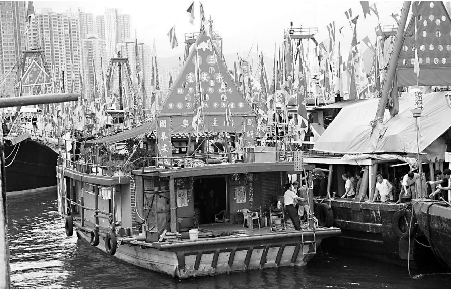
銅鑼灣廟船在每年誕期駛往香港仔避風塘停泊