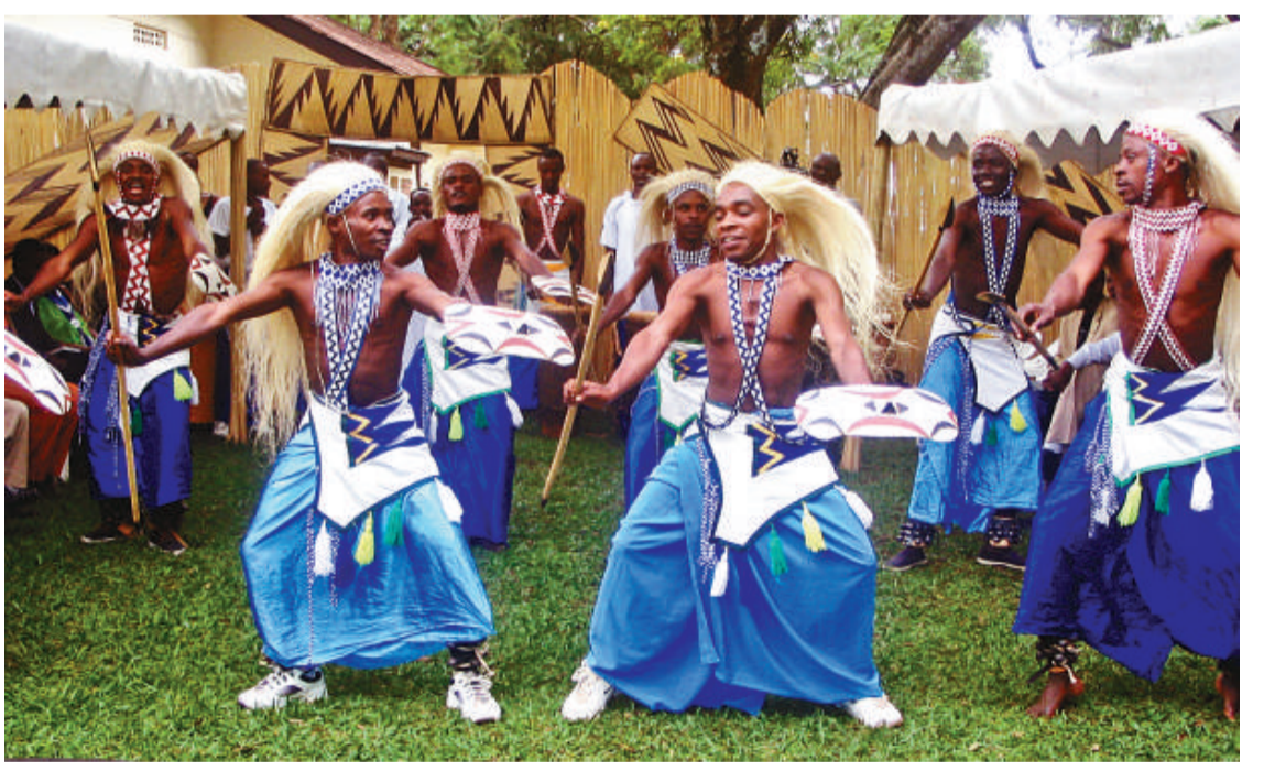
▲非洲藝術家帶來的原始非洲歌舞

世博會的文娛演出舞台，自然少不了各參展國的藝術家。作為全球最優秀的打擊樂團之一，來自布隆迪的鼓手們，已在世博「非洲廣場」上整裝待