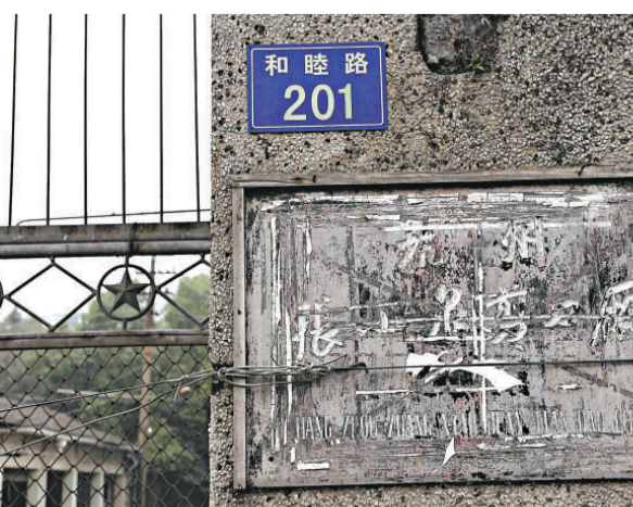
▲張小泉老廠區大門的招牌，見證了逾半個世紀的歷史

【本報記者王春苗杭州五日電】「北有王麻子，南有張小泉」，作為內地五金刀剪的兩大品牌，其市場佔有率曾在八成以上。然而，作為「中華老字號」的杭州張小泉剪刀廠前途卻堪憂，據了解，在杭州大關路的張小泉老廠區面臨被拆險境，其「鑲鋼鍛製」的技藝面臨失傳。