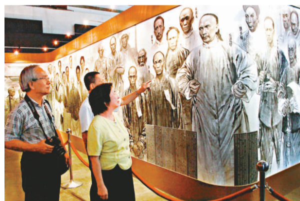
▲由大陸民間繪製800米抗日長畫在展出