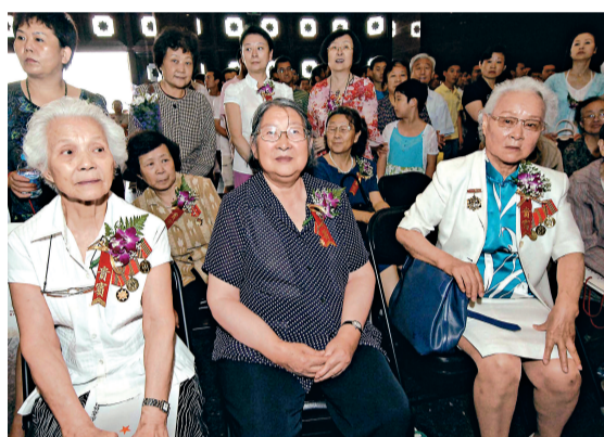
▲已故中國國家領導人劉少奇長女劉愛琴（前右）、毛澤東之女李敏（中），昨日出席在「俄羅斯專題展」開幕儀式