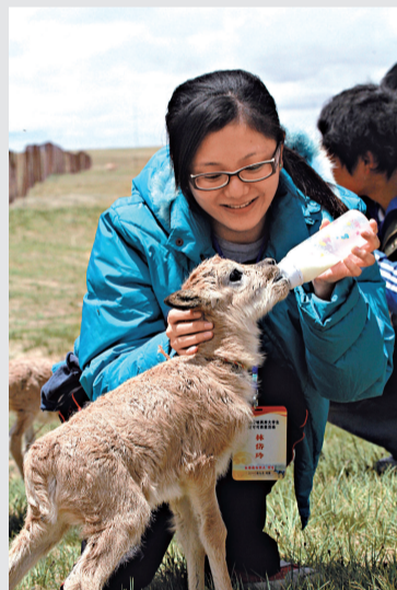
▲大學生在給可可西里保護區內的剛出生不久的小藏羚羊餵奶

【本報記者董曉、通訊員應秀麗西寧七日電】從海邊走進世界屋脊，從繁華都市走進荒無人煙的自然保護區，日前，40餘名來自台灣的大學生抵達青海省，與青海的大學生一起，攜手參加「第四屆海峽兩岸大學生走進可可西里」活動。