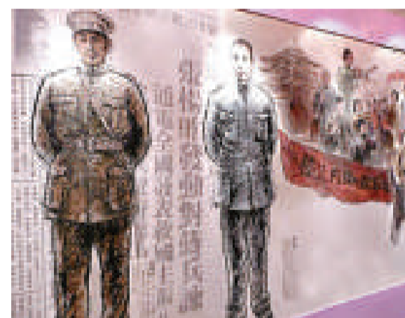
▲周恩來（右）、張學良（左）也入畫 中評社

連戰說，從1895年台灣割讓給日本之後，日軍在台灣北部登陸據台，開始武裝鬥爭，之後綿延50年之久，那種椎心泣血的感覺，是老一輩的台灣人永遠不會忘懷的，透過武裝鬥爭、文化活動，具體透過社會運動，與日本人在台灣的統治周旋到底，犧牲相當慘烈，過程不能抹煞。