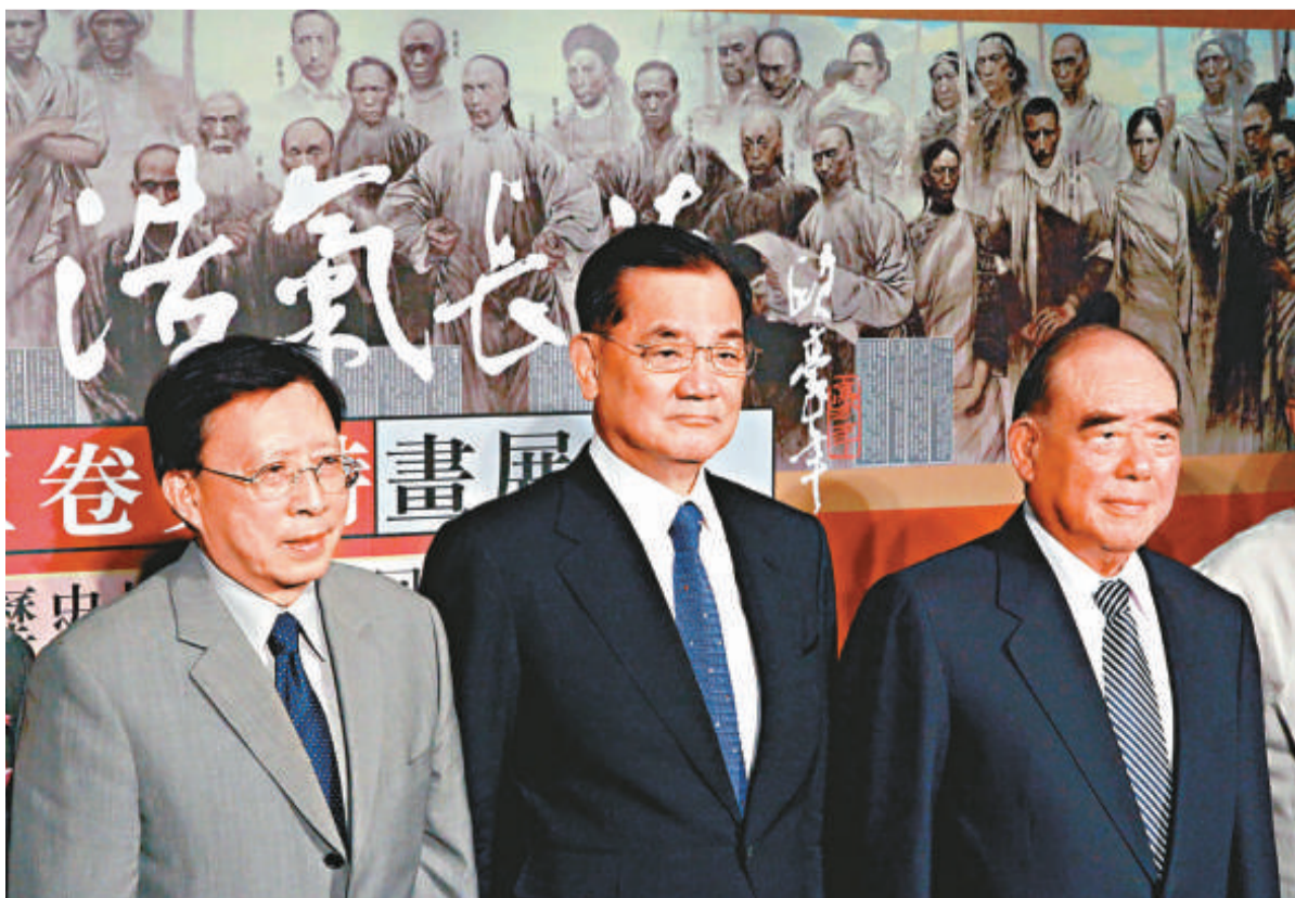
▲連戰（中）與郝柏村（右）、劉兆玄等人參加畫展時合影