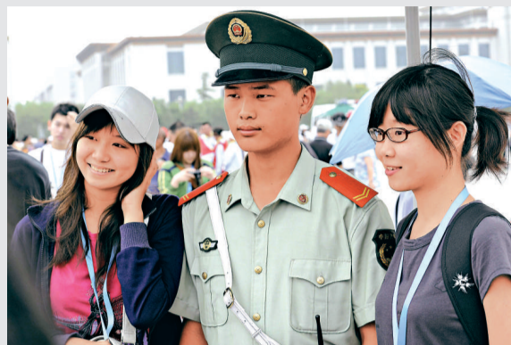
▲「2010年台胞青年千人夏令營」營員昨日來到天安門廣場和執勤的武警戰士合影