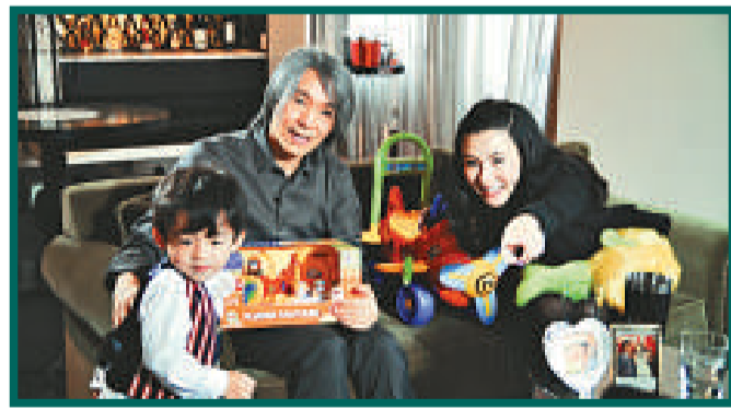
▶星爺聯同栢芝母子在風凰衛視接受訪問

香港話劇團將於本月 24 日起於文化中心大劇院公演 9 場的新劇目《魔鬼契約》昨舉行發布會，闊別舞台 27 年的萬梓良，將重返舞台扮演魔鬼斯諾一角，他表示演出舞台劇是最大的挑戰，也是最大的享受。