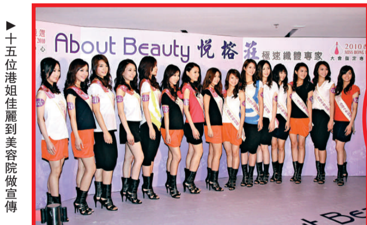
▶十五位港姐佳麗到美容院做宣傳

萬子在七、八十年代曾為香港話劇團演出多個劇目，對於今次重返舞台，他雖然也感到壓力，但更多的是興奮和開心。他道：「不似拍電視劇、電影，演舞台劇每一場都要帶給觀眾新鮮的感覺，一定要用自己內心的誠意來支持演出，這也是舞台劇令我着迷的魅力。」他笑言離開話劇團後，自己過了一段漫長的廢爛生活，這次重返舞台令他重拾以前的活力，充滿熱情。他更自爆每次演出前自己都要刷牙、洗手，皆因演舞台劇好神聖。