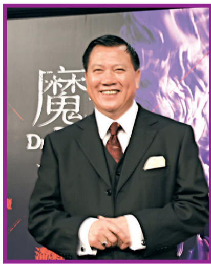
▲萬梓良稱演出舞台劇是最大的挑戰