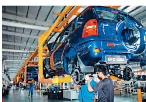
▲美國電動車巨頭ZAP擬併購永源汽車，意在進軍中國市場

動車供應商之一。自一九九四年以來，該公司已在逾75個國家售出超過11.7萬輛的各類電動車。ZAP不僅為美國軍方、政府和企業車隊供應電動卡車和貨車，同時也是電動摩托車、滑板車和全地形車領域的創新者。