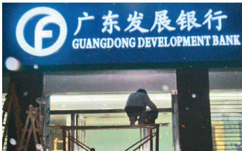
▲廣發行表示，該行150億元的增發股份方案已獲銀監會批准，近期已啓動發行程序

廣東發展銀行相關人士昨日表示，該行150億元（人民幣，下同）的增發股份方案已獲中國銀監會批准，近期已啓動發行程序，並於本周三（七日）起開始認購。