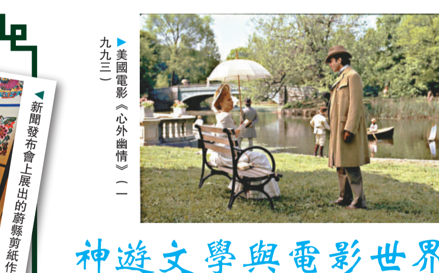
美國電影《心外幽情》(一九三三)