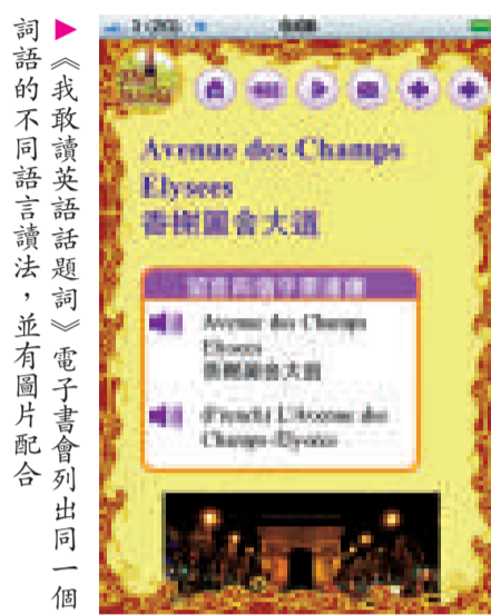
《我敢讀英語題詞》電子書會列出一個詞語的不同語言讀法，並有圖片配合