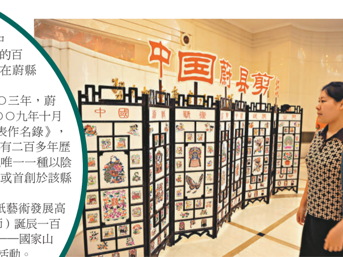
新聞發布會上展出的剪紙特色屏風