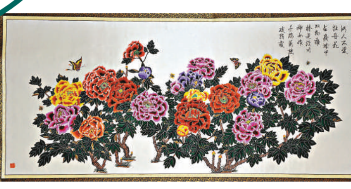
蔚縣剪紙作品——吉祥富貴圖