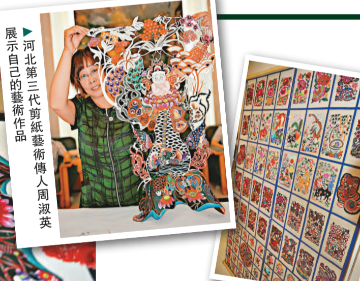
展示自己的藝術作品