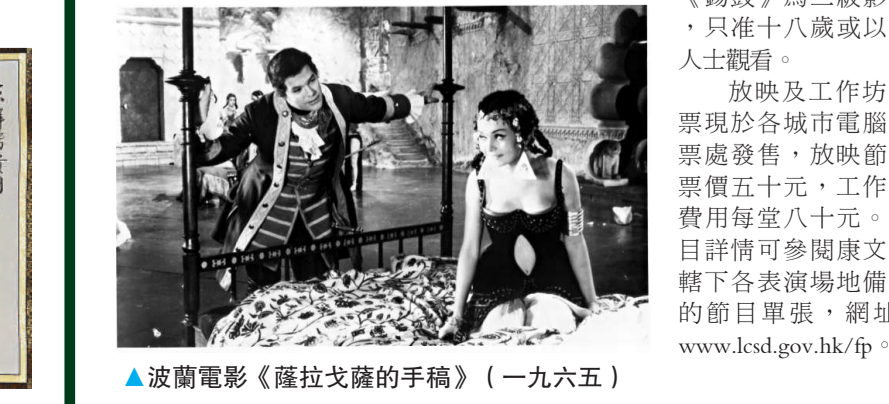
波蘭電影《薩拉戈薩的手稿》(一九六五)

放映地點為香港電影資料館電影院及香港太空館演講廳，於香港電影資料館放映的場次，相關影評人將與不同的嘉賓在放映會後與觀眾分享對該片的解讀。