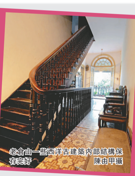
老倉山一些西洋古建築內部結構保存完好