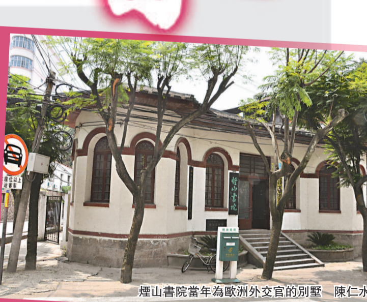
煙山書院當年爲歐洲外交官的別墅