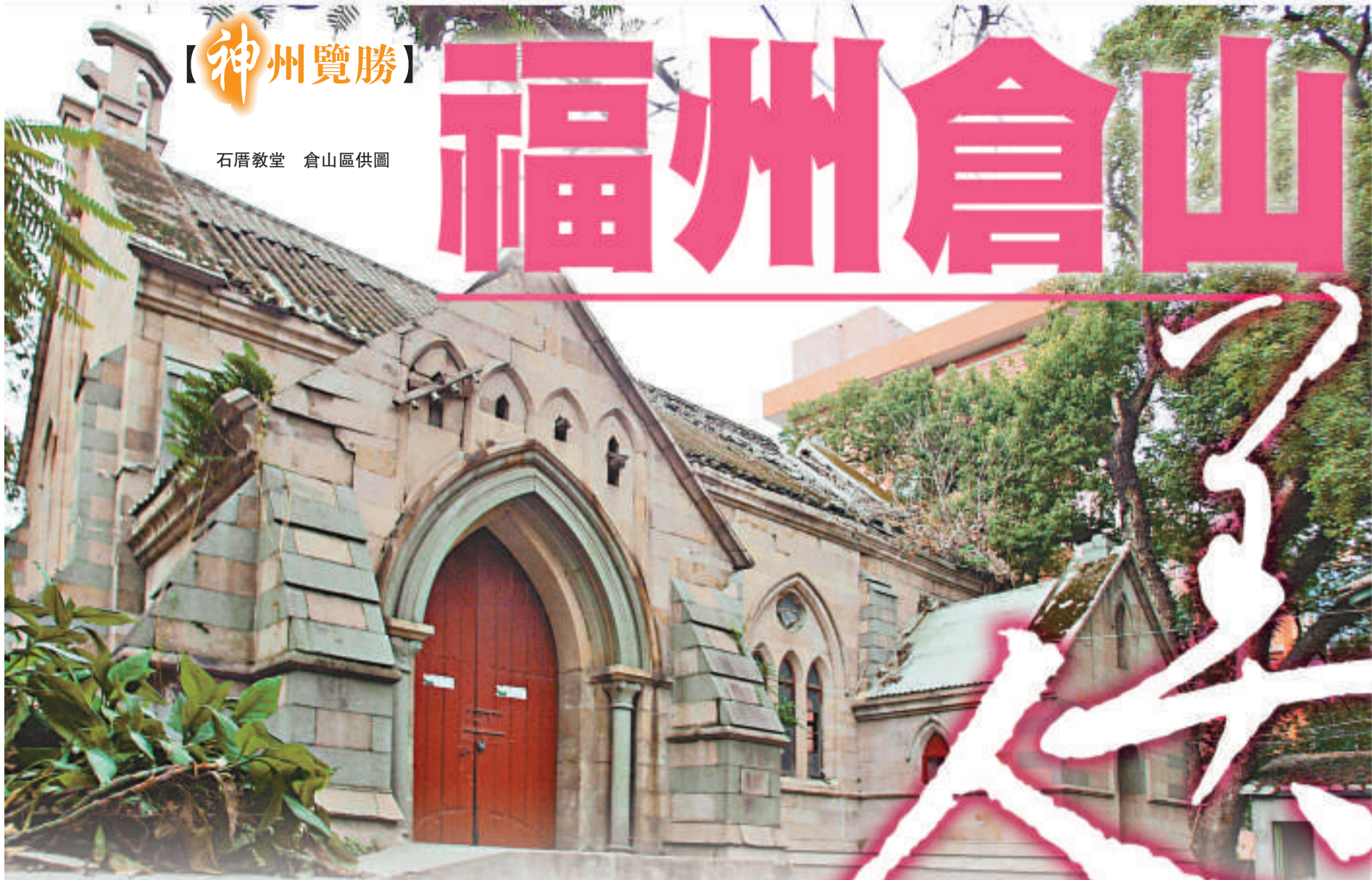
石厝教堂

紅牆、小院、青石地面、歐式木窗……在許多老福州的記憶裡，倉山曾是福州最有異域風情和歷史底蘊的地方。林立其間各式各樣的小洋樓，讓倉山贏得「萬國建築博物館」的美名，然而，小洋樓在都市化進程中漸漸消失，福州僅存的「洋味」正一點一點地被人為的抹去。 本報記者 陳仁水