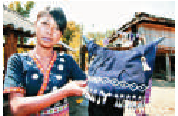
▲排角人女性佩戴的黑色頭飾形似一排牛角 網上圖片