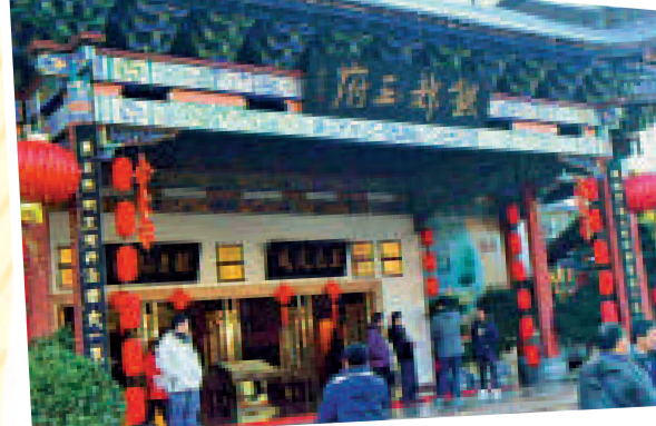
▲銀都玉府 網上圖片