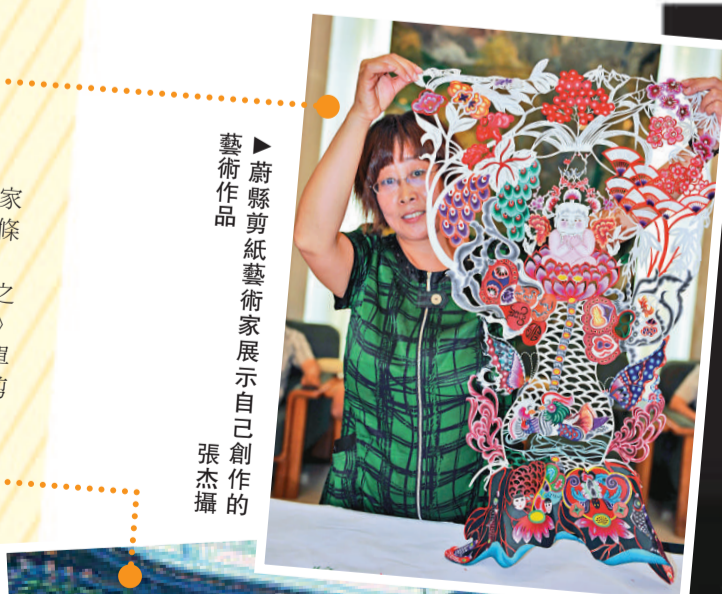
▲蔚縣剪紙藝術家展示自己創作的藝術作品

大理州於2008年開始，投資建成了東南亞最大的手工藝品展示園，鳳凰山綠化、新華國際生態園等，完善修復了水磨坊、古戲台等歷史古遺址，五星級維景國際酒店也即將開業。下一步還將投資10億元對新華村進行深度開發，目標是將銀都水鄉升級爲5A級旅遊景區，整個項目計劃2015年完成。