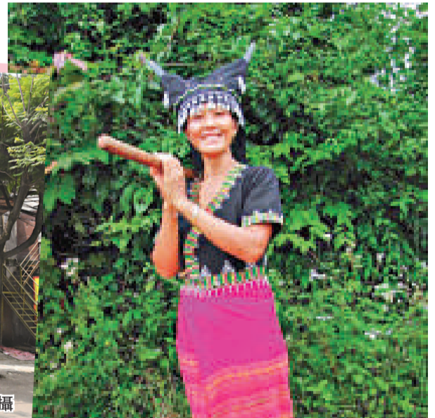
▲排角人被認定爲哈尼族的一個支系