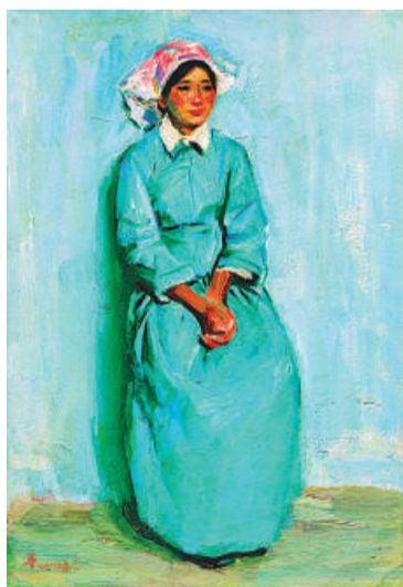
詹建俊作品《蒙族少女》

相對於大型創作而言，小幅油畫的創作更利於風格、語言和材料的研究。中國油畫學會表示，它可以使油畫家以輕鬆的心態進入研究與藝術創造中，它可以是灑脫率真的寥寥幾筆，也可以是「大珠小珠落玉盤」的精美製作，