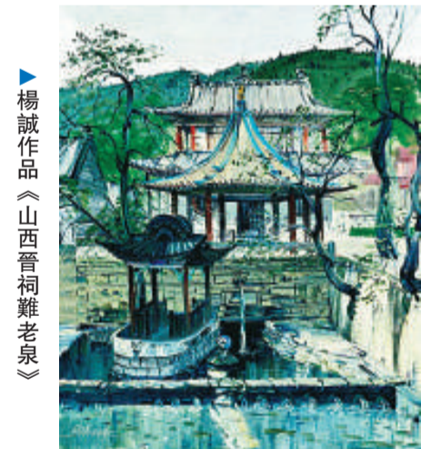
楊誠作品《山西晉祠雜老景》

積極影響。「研究與超越——第二屆中國小幅油畫展」組委會有關負責人介紹，展品從全國各地的六千餘件作品中精選出來，體現近年來小幅油畫創作的基面面貌。這些作品，以廣闊的視角，反映了當代豐富多彩的社會生活和氣象萬千的大自然景象；以多樣化的藝術手法，表現出油畫語言探索與研究的新風貌。