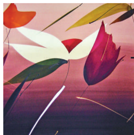
Lola 《The sound of the line》