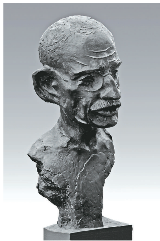
薛林納青銅雕塑《聖雄甘地》

薛林納表示，甘地領導了「非暴力不合作運動」，使印度從英國的殖民統治下獲得解放。美國黑人領袖馬丁·路德金和南非黑人領袖曼德拉都會追隨甘地的腳步，把他作為榜樣，並最終實現了民權運動的勝利。因此，甘地不僅是印度人民心中的國父，同時也是世界人民的驕傲。大型青銅雕塑《聖雄甘地》在上海藝博會上展出，在時間上也具有非常特殊和重要的意義。第六十一屆聯合國大會通過決議，將今後每年的十月二日甘地誕辰日，定為「國際非暴力日」，而每年的九月二十一日則定為「國際和平日」。此次甘地雕塑展於上海，也意在迎接上述兩個重要日子，並以此提醒所有人珍惜世界和平，珍惜生命。