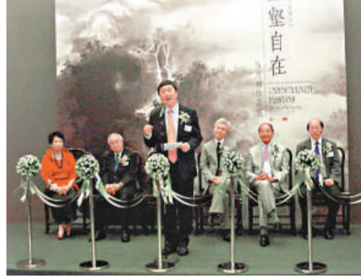
本報攝 中文大學校長沈祖堯致辭

【本報訊】實習記者阮鳳娟報導：嶺南派畫家伍月柳四十幅近作，七月十一日起至明年二月七日在香港文化博物館展出。