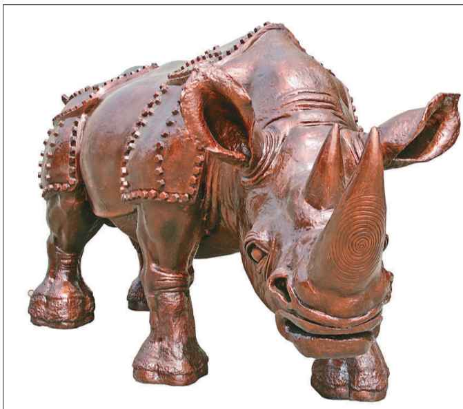
施力仁青銅雕塑《衝向勝利》

此外，經專家評審，「讓收藏成為風尚」被確定為今年藝博會的活動主題宣傳口號。藝博會組委會表示，確定這一口號，就是希望具有雄厚資金實力的財富人群，在擁有別墅、名車之後，能讓財富愛上藝術，把藝術消費作為一種時尚潮流，能把自己的藝術藏品作為社交中的時尚話題，能把出席每年一屆的藝博會當成一次重要的年度社交盛會。