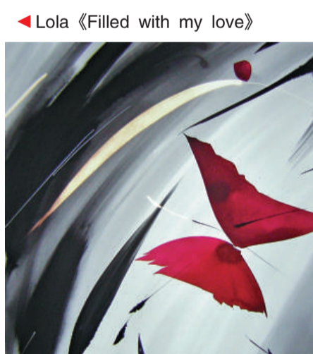
Lola 《Filled with my love》