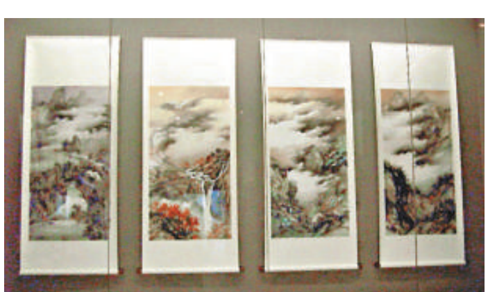
伍月柳作品《四景山水》