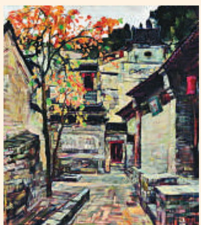
謝麟《鞏義康百萬莊》