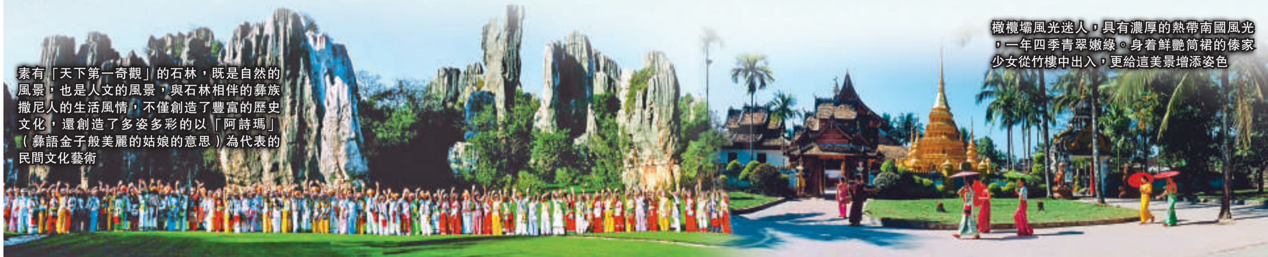
素有「天下第一奇觀」的石林，既是自然的風景，也是人文的風景，與石林相伴的彝族撒尼人的生活風情，不僅創造了豐富的歷史文化，還創造了多姿多彩的以「阿詩瑪」（彝語金子般美麗的姑娘的意思）為代表的民間文化藝術