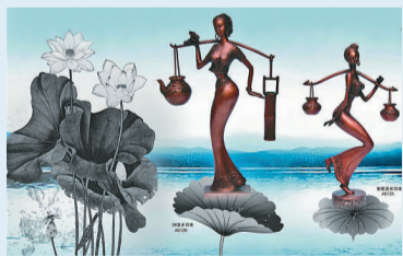
▲斑銅工藝品是雲南獨有的民間傳統工藝品，至今已有300多年的歷史

非物質文化遺產能否實現有效保護和傳承，是實現建設民族文化大省向民族文化強省邁進的關鍵環節和重要基礎。保護和利用好這些非物質文化遺產，對於維護民族團結和邊疆穩定，建設社會主義先進文化，構建和諧社會，促進雲南經濟社會可持續發展，都具有十分重要的意義。