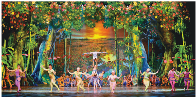
▲雜技童話劇《雨林童話》