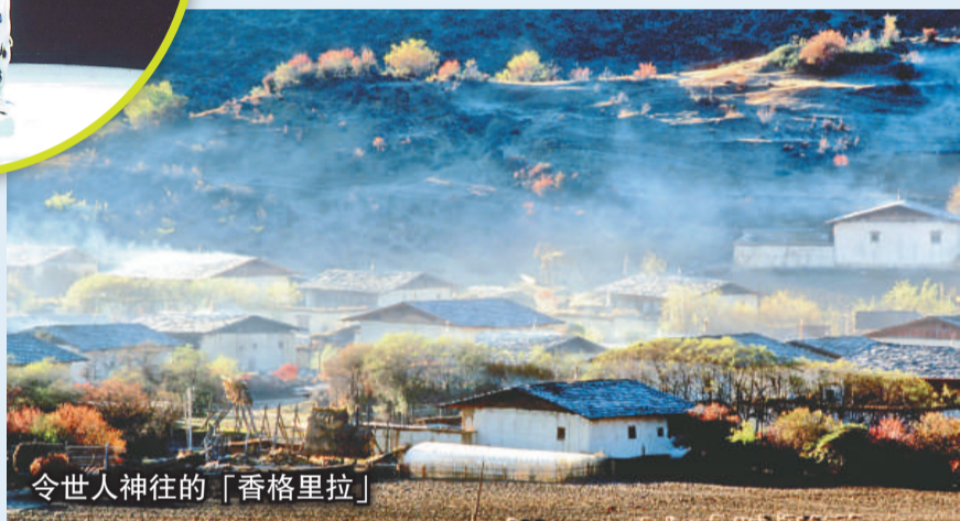
令世人神往的「香格里拉」