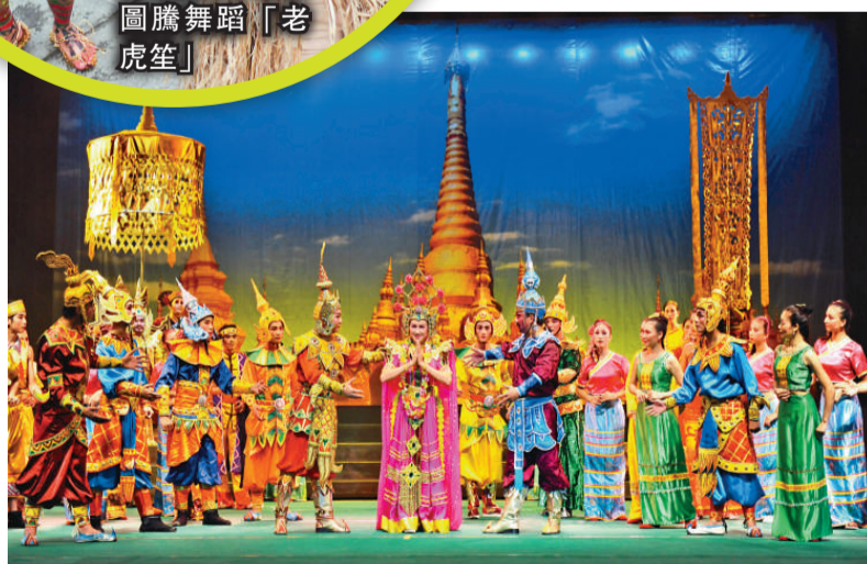
▲西雙版納歌舞秀《勐巴拉娜西》，以傣族文化為主線，融合了多民族的傳統文化藝術和現代的表現形式，集民族性、藝術性、觀賞性、時尚性為一體，將傣家特有的民族文化與風情推到了極致

雲南是一個世所罕見的「民族文化聚寶盆」，我們熱忱歡迎香港同胞和海外僑胞來雲南觀光旅遊和投資創業，我們將大力發展文化產業，把雲南打造成真正意義上的「投資熱土，旅遊天堂」。