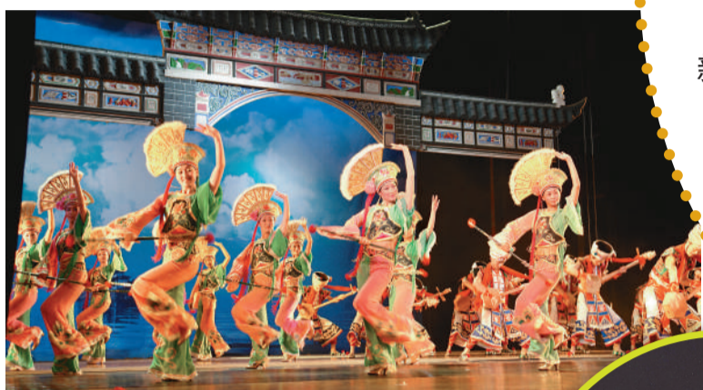
▲大型夢幻舞劇《蝴蝶之夢》獲得了中國舞蹈荷花獎的最佳編導獎和最佳舞台美術兩大金獎

當我們沿着千年的茶馬古道走進麗江，走進神秘靈秀的古納西王國，便深深地體會到雲南民族文化的底蘊和氣質之美。一首首充滿深情的民族歌曲，反映的是少數民族的深情好客和豪爽氣概；一場攝人心魄的《雲南映像》民族文化風情演繹，讓我們看到了一個神奇的民族世界；一曲《月光下的鳳尾竹》、一段《孔雀舞》在幽幽的葫蘆絲聲中，在婀娜多姿的舞步裡，讓我們聯想到的是個美麗、溫和、多情的民族，這些民族所固有的特質，都是歷史長河中折射出的文化智慧的結晶。