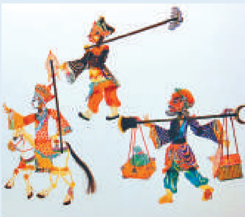
▲有着600多年歷史的騰冲皮影戲來自中原，經代代相傳形成獨特的風格，被稱為「雲南大皮影」。被列入國家級非物質文化遺產保護項目