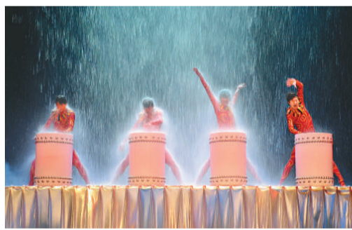
▲大型舞台劇《夢幻騰冲》，一台充分展現騰冲魅力的文化大餐