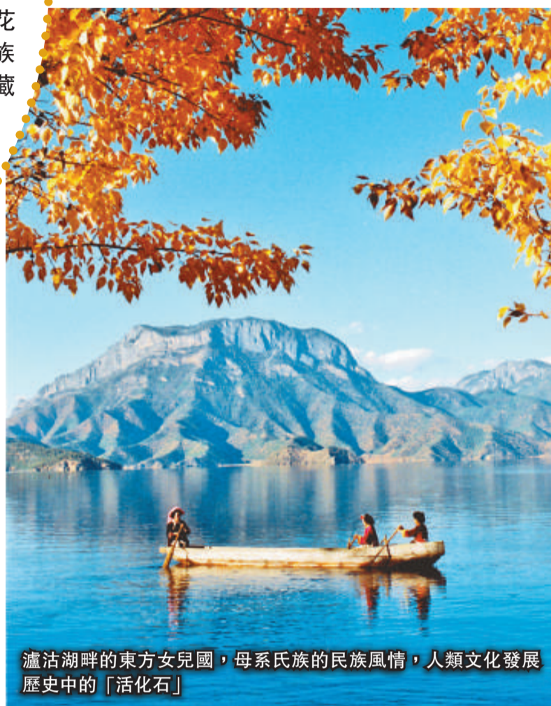
瀘沽湖畔的東方女兒國，母系氏族的民族風情，人類文化發展歷史中的「活化石」