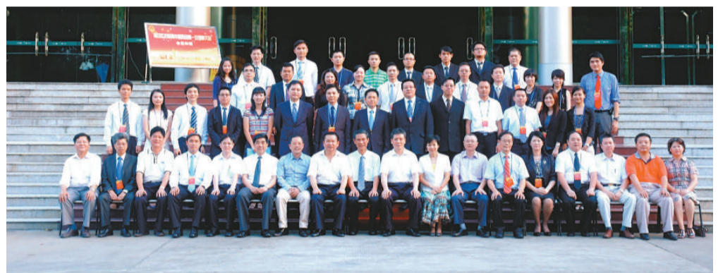
▲第一屆福田區僑聯青年委員會全體理事合影

年委員會，對於加強該區與海內外僑胞及港澳同胞新生代的聯繫，團結和培養僑界青年骨幹力量，特別是為僑界青年施展才華、回國創業、發展事業、維護權益等方面提供具體而有實效的服務，拓展和延伸新時期僑聯工作，具有深遠的意義。