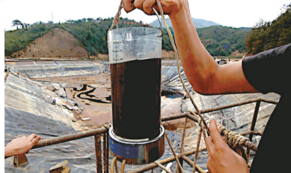
▲工作人員從紫金山銅礦濕法廠污水池中抽取含銅酸水樣本 汀江污染事件相關責任進行調查，一旦調查結束將嚴肅處理相關責任人。而據記者了解，上杭縣環保局長已因此次汀江水污染事件引咎辭職。