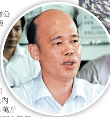
▲上杭縣網箱養魚日前大規模死亡，死魚漂滿水面 ▲福建紫金礦業總裁羅映南指該企業遭遇重大污染事故，廠區已停止生產