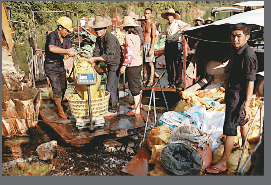
▲紫金礦業重大污染致大量魚死亡，上杭縣政府以一斤六元的價格回收死魚 中新社