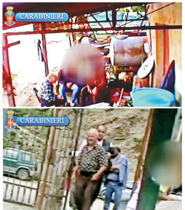
▲會使「光榮會」變成少壯派的天下。

美國米德伯里大學的「光榮會」專家安東尼奧·尼卡索指，這次行動是史無前例的罪案調查，因為它不但發現了「光榮會」的組織方式，還查出了它的峰會、成年禮和頭目選舉是什麼樣子。他又說，在這次行動前，「光榮會」已展開了新舊交替，因為許多上了年紀的頭目被捕，許多年輕成員因而「上位」，這輪捕行動將