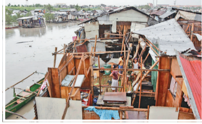
▲「康森」致使菲律賓首都馬尼拉南部大面積水浸 ▲馬尼拉南部居民在風暴結束後修補他們的棚屋