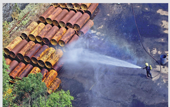
▲印度一名消防員正在進行氯氣防堵工作

【本報訊】綜合通訊社孟買十四日消息：印度孟買的氯氣泄漏事故，中毒住院人數增至 92 人，其中多是學生。事故造成至少 3 人死亡，另有 10 人在加重病房得到特別治療。