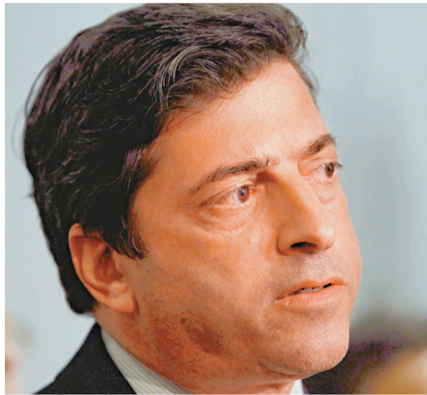
▲美國證交會執行主任羅伯特·庫扎米稱，高盛願意支付 5.5 億美元和解

依據高盛財報數字，去年營收 485 億美元、淨利 138 億美元、營運現金流逾 380 億美元，如此雄厚財力，5.5 億美元罰款及賠償實微不足道，不到去年 14 天的淨利。 SEC 指控高盛 3 年前銷售房貸金融衍生產品時，未充分披露資訊（同一產品另有作手賣空），導致買家蒙受重大損失（近 10 億美元），涉金融欺詐，因而提訟。 但是，對被高盛誤導的投資者而言，公正仍未實現。證交會指高盛在這宗庭外和解協議中承認，其市場推廣訊息未夠全面，遺漏了關鍵資料。但高盛仍堅稱沒有違法，只是錯在沒有向投資者披露高盛的客戶有份設計該批證券產品，導致出現利益衝突。高盛沒有像一些管理層擔心的那樣被迫犧牲掉任何高管，包括行政總裁布蘭克費恩。 而且，這筆罰款中，3 億美元上交美國證交會，另外 1.5 億美元和 1 億美元分別用於賠償在欺詐案中受害最深的德國工業銀行和蘇格蘭皇家銀行，而投資者總體損失高達