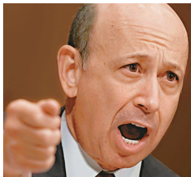
▲高盛集團行政總裁布蘭克費恩 4 月出席美國國會聽證

10 億美元。在美國證交會提出指控後，投資者也對高盛提起了 18 起相關訴訟，高盛已請求法官將這些訴訟合併審理。