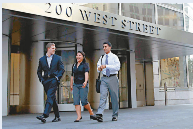
▲投資銀行高盛集團總部位於紐約曼哈頓下城 West 大街 200 號

雖然高盛欺詐案的結局比它對高盛的影響有利，但自從規管人員 4 月提出和「Abacus」結構性金融產品有關的欺詐指控，震驚投資者以來，高盛在華爾街那穩固的優越形象經已受損。 高盛的主席兼行政總裁布蘭克費恩和營運總裁科恩如今所領導的高盛，其實正處於 1994 年債券市場騷動期間合夥人鬧分裂以來最脆弱的時候。高盛的高層今年也許會有變動。 除了支付罰款和作出賠償，高盛已同意收緊推銷涉案那一類交易的方式，相信新的推銷方式不會造成太大的痛楚。如果不是該宗欺詐案對高盛的公信力造成較廣泛的影響，高盛也許早已鬆脫險了。 但高盛在過去 4 個月已承受莫大痛苦，至今仍在復元中。也許最不堪回首的事件是華盛頓的聽證會，當時和「Abacus」投資產品有關連的交易員和高層，包括至今仍在面對證交會指控的圖爾，都有作證。 人們也許仍要等一段長時間，才能淡忘高盛基層僱員那種有處處提防而且令人不感自在的態度——這和該銀行喜歡營造的低調、受到尊重的形象有莫大差異。雖然這些人否認自己犯錯，但他們的作為似乎未如投資銀行同業摩根大通那句名言所形容那樣：「以第一流的方式做第一流的事」。 這宗欺詐案的解決，不但嚴重審視了高盛的領導層，還對高盛 1999 年正式上市以來的發展方向作出嚴厲的質疑。布蘭克費恩和科恩都是來自該銀行的交易部門，對業務的態度也以進取和希望有利可圖為特色。