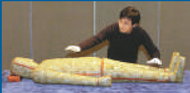
▲徐州西漢楚王陵金縷玉衣