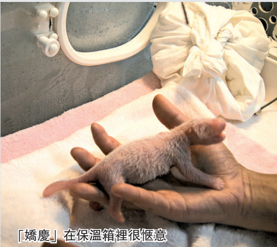
「嬌慶」在保溫箱裡很愜意

【本報記者郭婷呼和浩特十六日電】7 月 16 日晚，內蒙古自治區呼和浩特市以一場大型文藝晚會拉開了第十一屆中國呼和浩特昭君文化節的序幕。開場戲是近 200 人的舞蹈《激情敕勒川》，另有歌曲《牧歌》、器樂曲《風馬》等民歌演繹。來自非洲的郝歌、美國的得州牛仔鄉村樂隊以及來自蒙古國的歌手們，帶來了《美麗的草原我的家》、《游牧之歌》、《Girls Dance》等，在呼和浩特市引領了一股世界草原風。