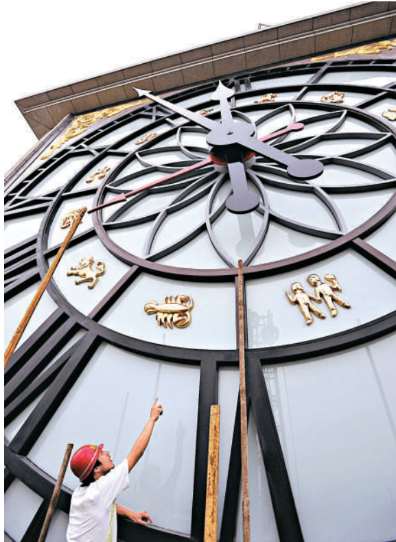
▲江西贛州 113 米高的「和諧鐘塔」將取代英國大笨鐘塔樓，成為世界上最大機械鐘塔

今日，在距離事發沙坪公園數十里外的重慶機場，記者聯繫了國航重慶分公司、川航重慶公司等機場駐紮單位，對方均表示近日自己所在公司的航班未曾受到影響或延誤；當詢及重慶機場的管理或技術人員時，他們均表示對此不知情、或未聽說。重慶民航監辦的鄧主任也表示他不掌握這一情況。