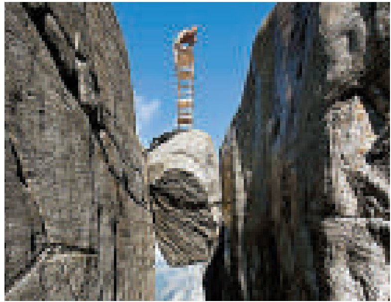
▲挪威一對行為藝術家，在懸崖上挑戰高難度動作