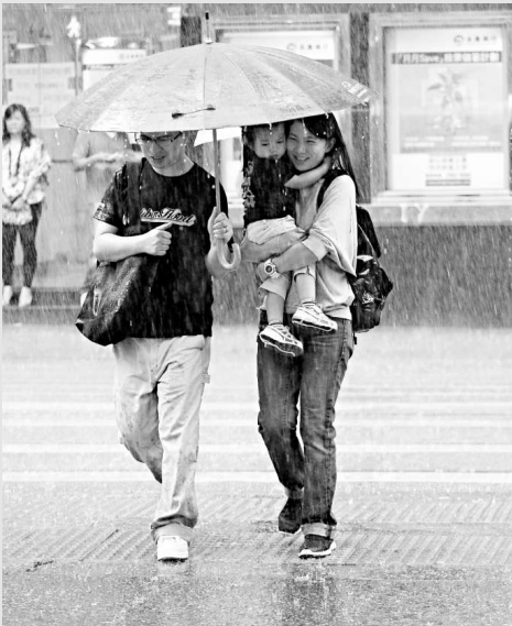
◀「康森」雖沒有直接襲港，但本港昨突降暴雨，市民甚為狼狽

沈祖堯還表示，中大已經決定會在校園擺放孫中山像。新民主女神像的安排要留待開學後，向師生和校友諮詢後再決定。中大每學期會與學生會代表、副校長以及院長一齊開會，討論大學最新發展；他將會與學生非正式會面，如一齊用膳，以及利用網誌與學生交流。