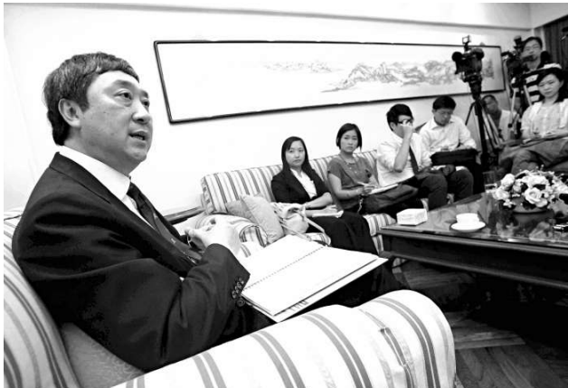
▲沈祖堯表示，中大擬辦的私立醫院，會優先考慮開辦如眼科手術和心臟檢查等服務 資料圖片

【本報訊】香港中文大學一早表态有意在大埔興建私立醫院，三月正式向政府呈交意向書。中大新任校長沈祖堯昨天接受電台訪問時表示，中大目前作為教學醫院的威爾斯醫院，發展有限制，部分手術輪候時間過長。因此擬辦的私立醫院，會優先考慮開辦公營醫院長時間輪候服務，如眼科手術和心臟檢查等，為較有經濟能力的病人提供多個優質醫療服務選擇。