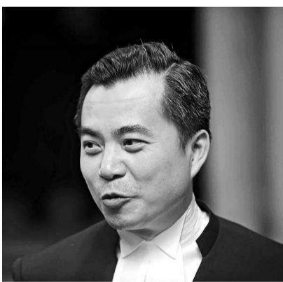
▲黃仁龍讚揚李國能對落實「一國兩制」有很大貢獻

【本報訊】作為「徒弟」，律政司司長黃仁龍昨日致詞時，高度肯定其「師傅」、終審法院首席法官李國能的貢獻。他說，李國能是一個新的憲法秩序中，法庭、終審法院在這方面建立了原則，在保障香港的基本人權，為香港的司法、為香港落實「一國兩制」，以及發展香港在這方面的法律內容，他都作出了很大貢獻。