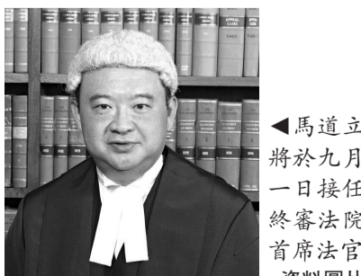
▲馬道立將於九月一日接任終審法院首席法官

本年六月九日，立法會通過同意委任馬道立為終審法院首席法官，任命於九月一日生效，多名議員認同馬道立過往能力，期望他能夠以無畏無懼精神，根據法律和公義進行裁決，捍衛香港法治精神。政務司司長唐英年表示，司法獨立是香港穩定繁榮的基石，他深信馬道立是在履行司法機構之首的職責方面，必會有傑出表現。