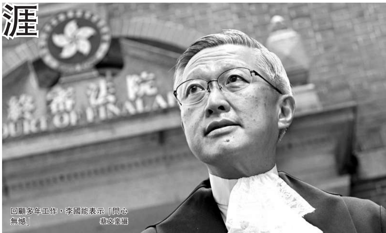
回顧多年工作，李國能表示「問心無憾」