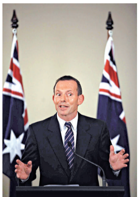
▲自由黨-國家黨聯盟的領導人阿博特是吉拉德的主要對手