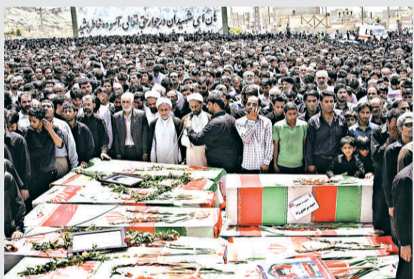
▲數千人17日在德黑蘭為15日清真寺恐襲的死者舉行喪禮

【本報訊】英國《衛報》17日報導：伊朗什葉派清真寺15日發生爆炸襲擊共造成至少28人死亡。伊朗革命衛隊的高級指揮官16日透露，美英兩國幕後向發動此次襲擊的遜尼派分裂組織提供了支持。