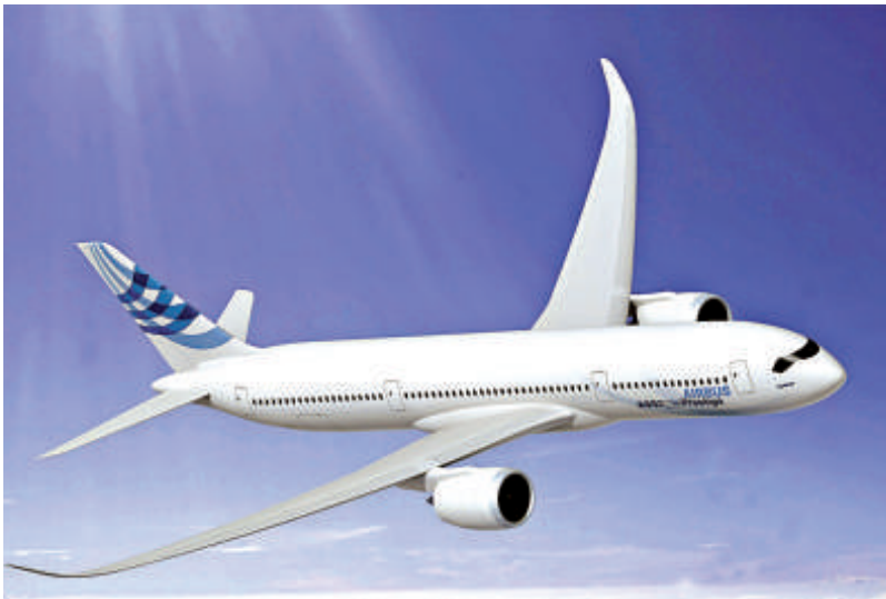
▲空巴首架超廣體A350大客機，載容量可達350人

【本報記者向芸成都十九日電】四川航空將於本月27日開通成都至馬爾代夫的航線，僅需6個半小時，而此前通過新加坡等第三國中轉，飛行時間往返就長達25個小時左右。直航班機每四天一班，由空巴A330執飛。