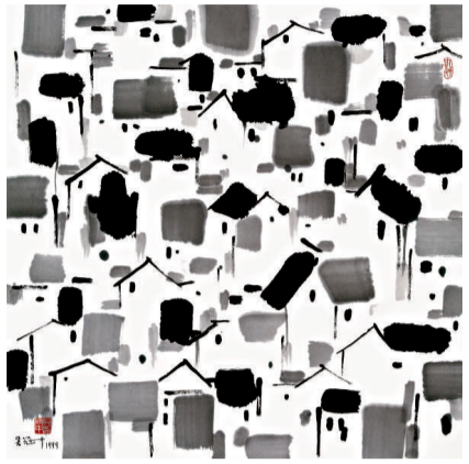
▲《人之家》(一九九九年)

【本報訊】記者張帆上海報導：我國傑出的藝術家、藝術教育家吳冠中上月二十五日在北京逝世，享年九十一歲。上海美術館為此將於八月十日至二十九日特別舉辦「吳冠中紀念展」，以紀念這位大師。