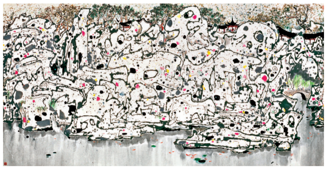
▲《獅子林》(一九八三年)