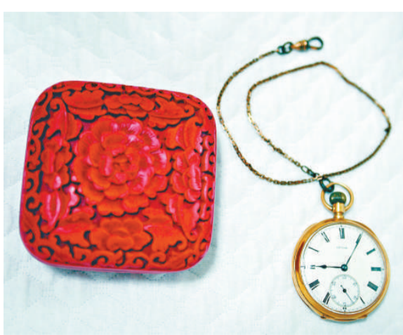
▲梁啟超用過的懷表，後梁啟超將懷表贈與梁思成

林洙還提到，一九四四年抗日戰爭勝利前夕，國民政府任命梁思成為「戰區文物保存委員會」副主任，梁思成列出了包括龍華寺宋塔、城隍廟廟園、南翔古猗園、徐家匯天主教堂等一批文物建築在內的清單，為保護這些優秀的建築作出了獨特貢獻。林徽因剛在八歲時即由杭州遷至上海讀小學，在滬四年的童年生活對她產生了極大的影響，因此她的文學創作亦多有上海的印記。