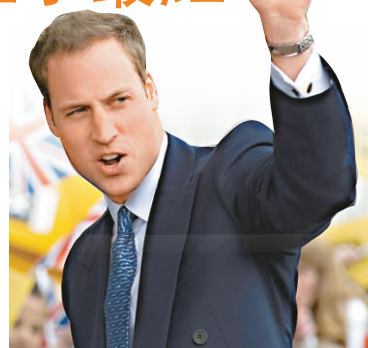
▲英國威廉王子的人氣在全球王室人員當中最

摩納哥「花花公子」阿爾貝二世如今修心養性了。6月，他把一枚據報價值10萬美元的戒指送給南非前奧運游泳選手維特施托克後，宣布和她訂婚。而排名第4位的維多利亞自從2006年遷往摩納哥並開始被人發現與阿爾貝二世在一起。隨着她在籌備傳言會在明年夏天舉行的王室婚禮，相信她的動向會