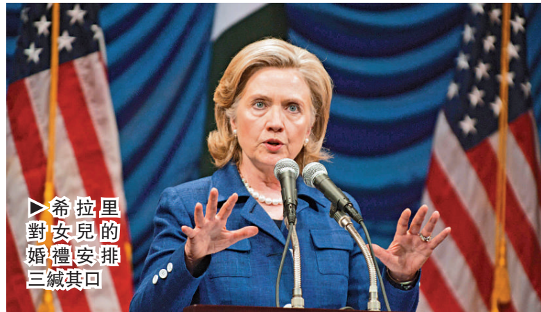
▶希拉里對女兒的婚禮安排三緘其口

法拉利展覽館 馬拉內洛總部以外，世界上最大規模的法拉利汽車陳列館，陳列法拉利歷史上各款經典和當代汽車。