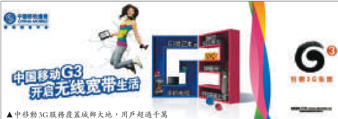
▲中移動3G服務覆蓋城鄉大地，用戶超過千萬

聯通日前公布3G上客量，六月份新增103.2萬戶，不過增幅較五月份有所放緩，該股昨日逆市跌近0.6%，收市報10.16元。瑞信發表研究報告指，最重要是確認聯通首季3G每月每