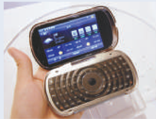
▲聯想樂Phone手機也出現信號不良問題

繼蘋果公司新產品iPhone 4的天線接收問題後，誓要與iPhone背水一戰的聯想集團(00992)旗下國產「樂Phone」，同樣遇到手