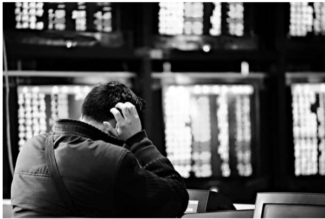
▲A股自本月初至今勁彈百分之五點四，跑贏全球股市