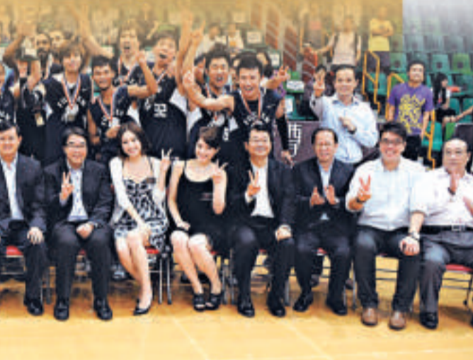
▼昨晚決賽，灣仔修頓室內場館座無虛席