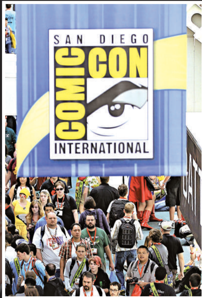
▲第41屆美國聖迭戈國際漫畫展22日在加州聖迭戈市開幕