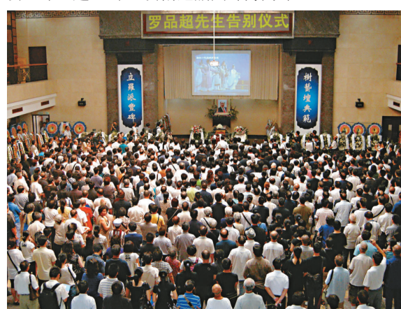
▲羅品超遺體告別儀式擠滿了自發前來參加活動的市民

有粵劇一代宗師之稱的羅品超，7月15日在廣州家中與世長辭，享年101歲。羅品超12歲開始登台，從藝至今已逾80年，藝術造詣蜚聲海內外。