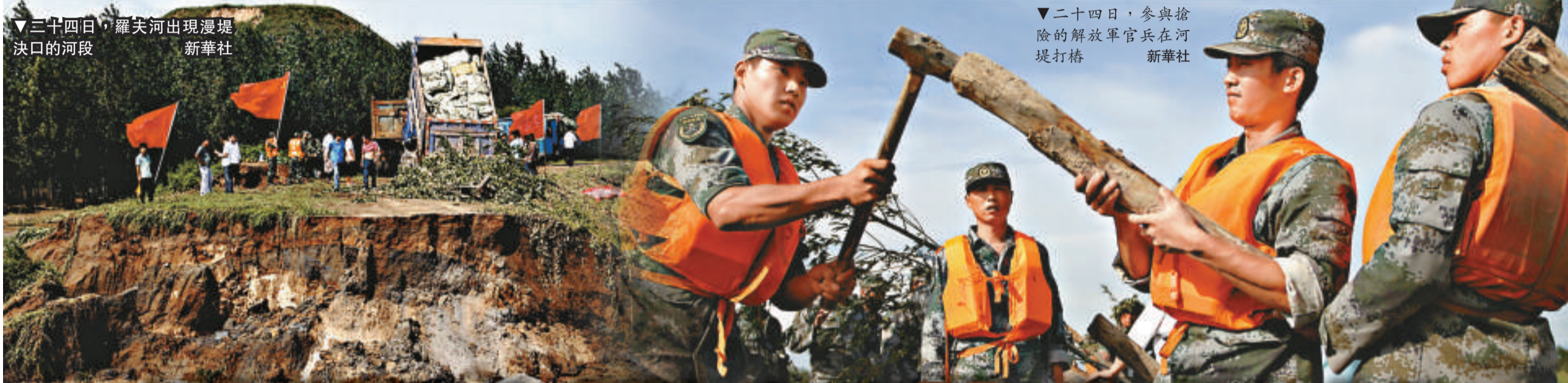
▼二十四日，參與搶險的解放軍官兵在河堤打樁