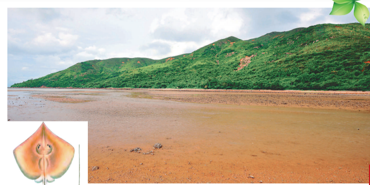
▲「齊格氏魷」的生境 ▲「齊格氏魷」

成魚最大者半米至不到一米。在香港的魚類相生組成中，屬沿岸及河口的底層魚類。與其他近緣「魷類」一樣，以滿布頭表的電感受器感覺獵物肌肉所發出的微電流，準確探知位置而捕食。由於攝食生物遺骸，清理腐肉，在水底發揮着防止水質惡化的重要生態功能。「齊格氏魷」是廣鹽性(euryhaline)魚類，常進入河口鹹淡水域生活，但不會游入內陸淡水域。本港沿岸淺海及河口均有蹤影，幼魚常在水流較緩的沙泥底沿海發育，香港西部大部分海域均屬幼場，本種在「國際自然保護聯盟(IUCN; International Union for Conservation of Nature)」的「紅色名錄(Red List)」(簡稱：IUCN Red List)上，被列作「保護現狀較低，但在不久的將來有瀕危或滅絕危險」的「近危(Near Threatened)」類別，必須注視其數量變化，加強保護，以免「齊格氏魷」這種小型「魷類」在本港瀕危。