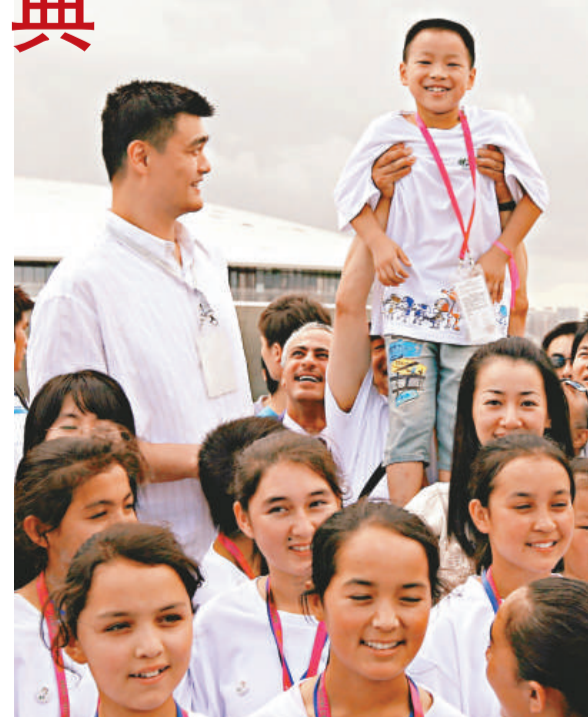
▲姚明等明星昨天與孩子們在上海世博園沙特館前合影，濮存昕在後排舉起一個男孩與姚明「比高」

據悉，「明星帶你看世博」大型公益活動啟動以來，得到了內地與香港諸多明星的全情支持，姚明、成龍、郎朗、劉德華、劉翔、李冰冰、周迅、黃曉明、陳奕迅等都出席了現場活動或參與了活動宣傳，而在世博園內，亦已先後迎來了楊瀾、張靚穎、李寧、王力宏等眾多文體明星。