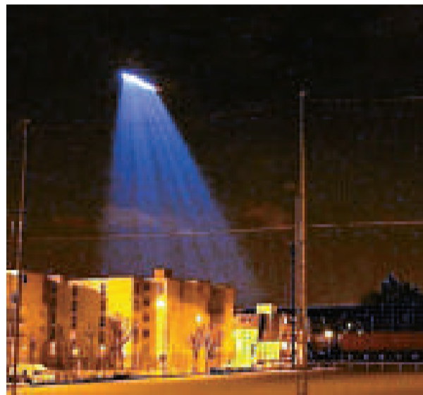
▲網上流傳的「不明飛行物」照片