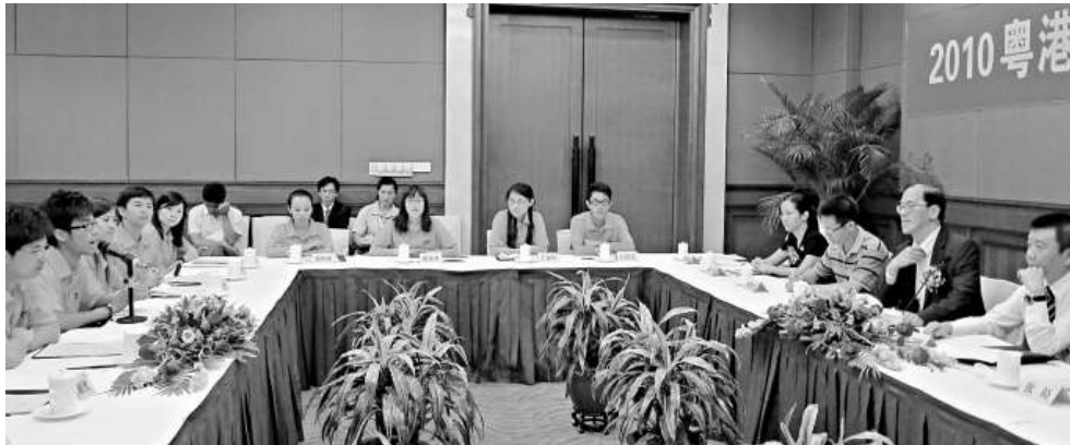
◀曾德成（右二）與《二〇一〇年粵港澳青年文化之旅》的參加者分享體驗