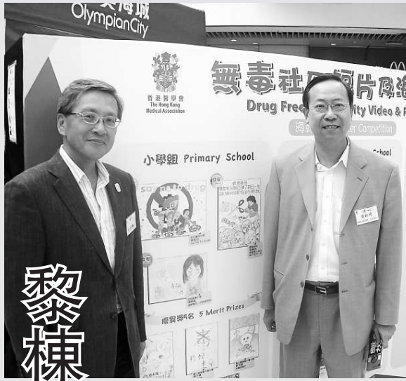
▲謝鴻興（左）與黎棟國為「抗毒之星耀社區」擔任主禮嘉賓

【本報訊】實習記者李溢藍報道：漫長的暑假是青少年吸毒的高峰期，香港醫學會昨日舉行「抗毒之星耀社區」，由保安局副局長黎棟國主禮，黎棟國呼籲青少年應趁暑假多參與一些有意義的活動，並藉此遠離毒品。