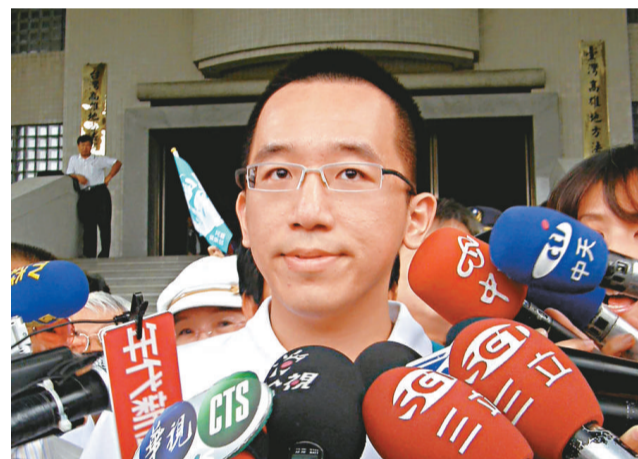
▲陳致中被《壹週刊》爆料疑涉召妓

【本報訊】據台灣媒體二十六日報導：在陳致中採取法律行動後，《中時電子報》隨即推出網上民調：「陳致中陷桃色風暴，醜聞、陰謀還是造勢？」自26日上午10時55分至下午2時20分為止，累計投票數為1395票，結果44%投票的民衆認為，陳致中這回是夜路走多遇到鬼，犯了「男人都會犯」的錯；30.5%認為是陳致中陳雲自導自演的苦肉計；17.4%覺得真相只有1個，但是民衆永遠無法知道答案；7%歸咎於選舉對手抹黑；另有1.1%表示沒意見。