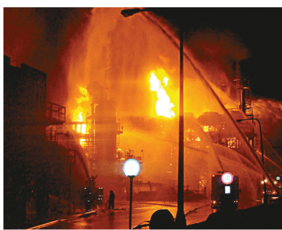
▲雲林縣麥寮六輕工業區台塑石化煉油二廠25日晚上發生火災，火光冲天

【本報訊】據中社二十六日報導：台灣雲林麥寮六輕工業區內的台塑石化煉油二廠，25日晚疑似重油外泄發生大火，到26日仍然持續燃燒，預估至少還要燒2天，才能把殘油燒盡。由於這是六輕20天內第二次