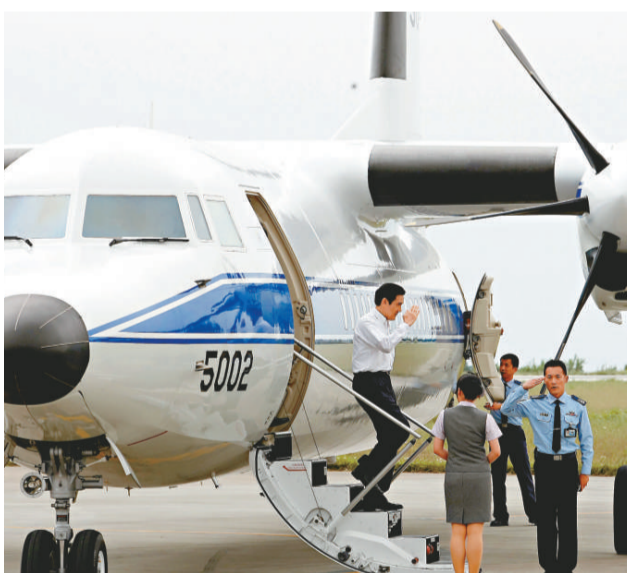
▲馬英九專機的安全性引起外界關注

監督飛安的「立法院」交通委員會藍委李鴻鈞驚嘆：「6年才檢查一次，安全意識太低、太離譜，檢查動作應更嚴謹。」他也呼籲「國家元首」以後應搭乘波音737「空軍一號」，不要再坐福克，「為省這種小錢，要是出了問題，就變成因小失大。」監督「國防」業務的「立法院國防委員會」綠委蔡煌瑯也說：「行政專機是『國家元首』和行政長官在坐，如軍隊不能把飛機維修好，真的是動搖『國本』。」