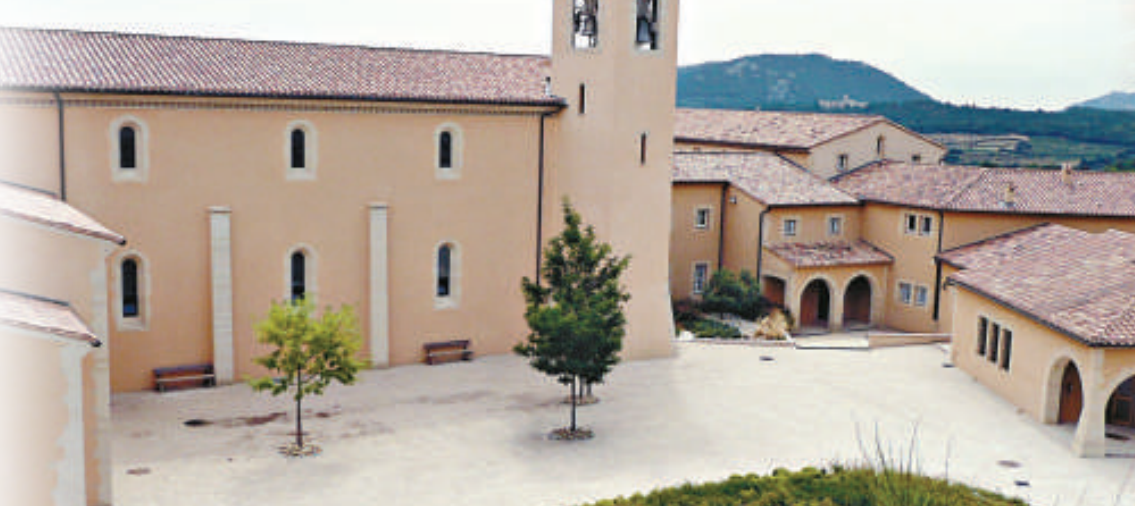
▼在法國南部偏遠地區的聖母領報修道院 互聯網