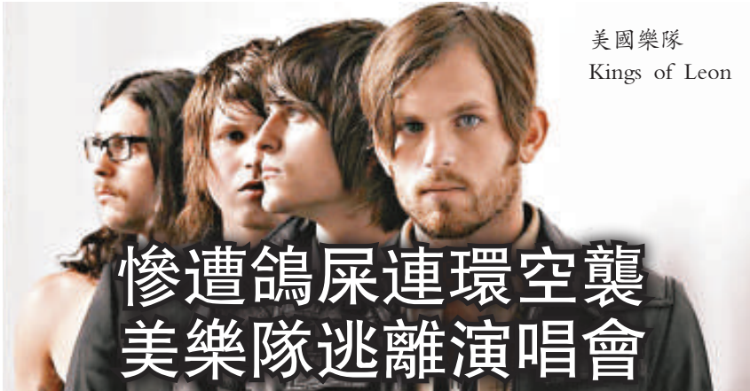
美國樂隊 Kings of Leon