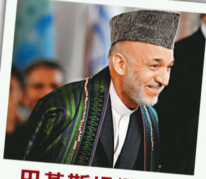
▲阿富汗總統卡爾扎伊

泄密的文檔包括100多宗北約部隊在當地濫殺無辜平民的事件。在其中一起事件中，一支美軍巡邏隊用機關槍向一輛巴士開火，打死打傷15名乘客。文件還披露了駐阿英軍部隊在喀布爾射殺平民的事件。據信，數位平民是在被美國在華達州遙控的無人機炸死的。文件還披露，2000名阿富汗平民被塔利班路邊炸彈炸死。許多誤殺平民事件此前並未得到披露。