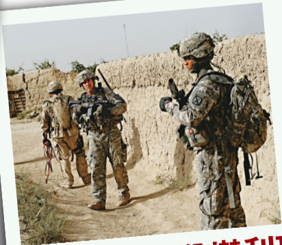
▲北約特種部隊負責「擊斃或俘獲」塔利班頭目

文件亦顯示，美軍沒有如實公開塔利班真正實力，塔利班因為得到巴基斯坦及伊朗暗中支援，獲得不少精良武器，如肩托式熱能追蹤及地對空導彈，曾用以擊落美軍直升機，但當時美軍沒有證實隱瞞塔利班的潛在威脅。美國駐喀布爾大使館的一篇秘密電報摘要指出，伊朗已採取連串步驟，擴大和加深它在阿富汗的影響力。該電報還援引阿富汗外交部的消息說，伊朗當時拿數百萬美元賄賂阿富汗的議會議員，又着手把改革派部長趕下台。文件提到，與九年前反恐戰初期相比，塔利班的實力有過之而無不及。