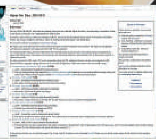
▲「維基解密」網站貼出逾9萬份駐阿富汗美軍的機密檔案 互聯網