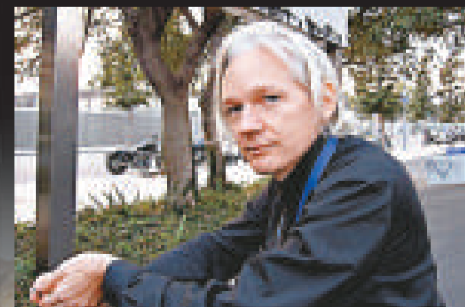
▼「維基解密」創辦人及總編輯亞桑傑