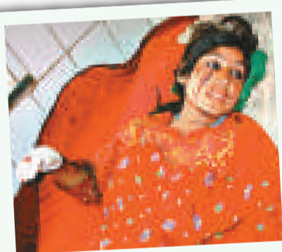
▲零七年被美軍炸傷的阿富汗婦女 資料圖片