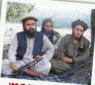
▲數名塔利班領導人接受媒體訪問 資料圖片

機密文件還披露，外國政府可能對塔利班分子發揮了影響。巴基斯坦每年從美國獲得10億美元以幫助其打擊武裝分子，但文件暗示，巴基斯坦三軍情報局成員曾會見塔利班頭目以組織針對美軍的抵抗行動，甚至打算暗殺美國支持的阿富汗總統卡爾扎伊。報告詳細說明了巴三軍情報局人員2006年如何組建自殺式襲擊者團夥，披露了使用自殺式襲擊者的整個過程，這些自殺式襲擊者是在巴基斯坦被招募和訓練的。有關這方面的大部分情報可能來自阿富汗情報部門，阿情報部門被認為敵視巴基斯坦，不過，美國軍方稱消息來源是可靠的。