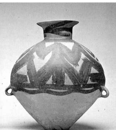
仰韶文化的彩陶器