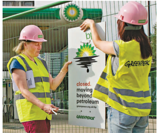
▲環保分子在加油站外豎起寫有「停止營業，超越石油」的標語

環保分子們在油站外豎起標語：「停止營業。超越石油。」「超越石油」是 BP 在 2001 年重新定位自己的品牌時的口號，旨在使人覺得該公司更環