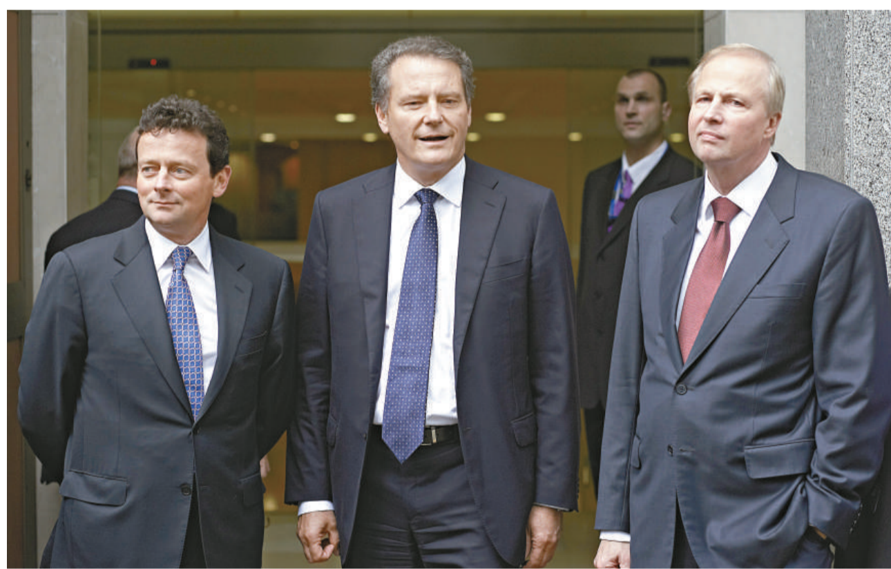
▲海沃德（左）、BP 董事長斯萬貝里及即將接任行政總裁的達德利（右）27 日在倫敦總部接受記者訪問

BP 稱持有「巨額額外銀行貸款額度，所有額度尚未提取」。同時，該公司還將 2010 年和 2011 年的資本開支削減至 180 億美元（此前的計劃開支為 200 億美元），並且取