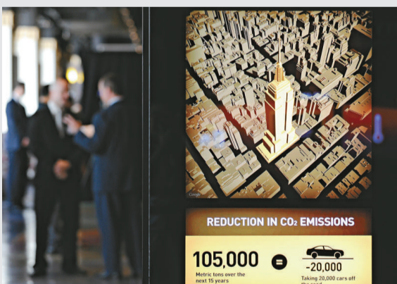
▲ 26 日揭幕的帝國大廈節能改造計劃展覽展示正在實施的改造方案

【本報訊】據中新社紐約二十六日消息：美國紐約市著名地標建築帝國大廈，目前斥資 2000 萬美元，對這座 102 層高的摩天大樓進行大規模節能改造。帝國大廈節能改造設計師莫伯格 26 日表示，希望在保持帝國大廈歷史面貌的同時，將其打造為「節能典範」。