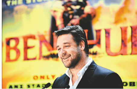
▲羅素對兒子十分疼錫