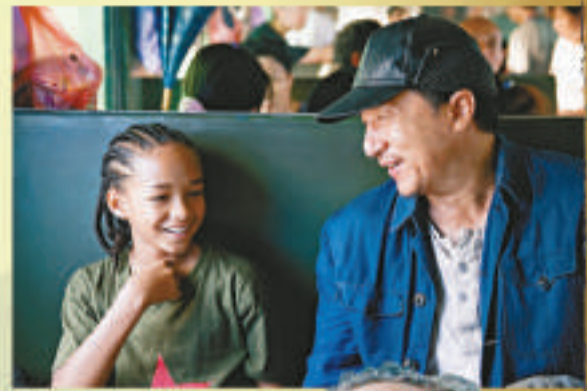
▲成龍（右）與積頓在片中為師徒關係

沿用一九八四年《龍威小子》同樣的英文戲名《The Karate Kid》的新片《功夫夢》，在中國電影市場一片熱鬧盛世的當下，不管是舊瓶新酒還是借屍還魂，有哥倫比亞、中影和國際巨星成龍的撐腰，加上電影歌頌歷史悠久的中國武術精神和真諦，又有中西方在文化及種族融和上大搞大同氣氛，想要取得中國觀眾歡心，絕非難事。