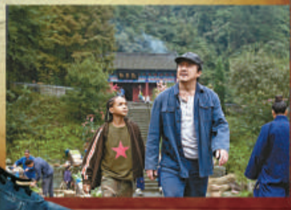
▼成龍（右）在《功夫夢》中飾演隱世高手