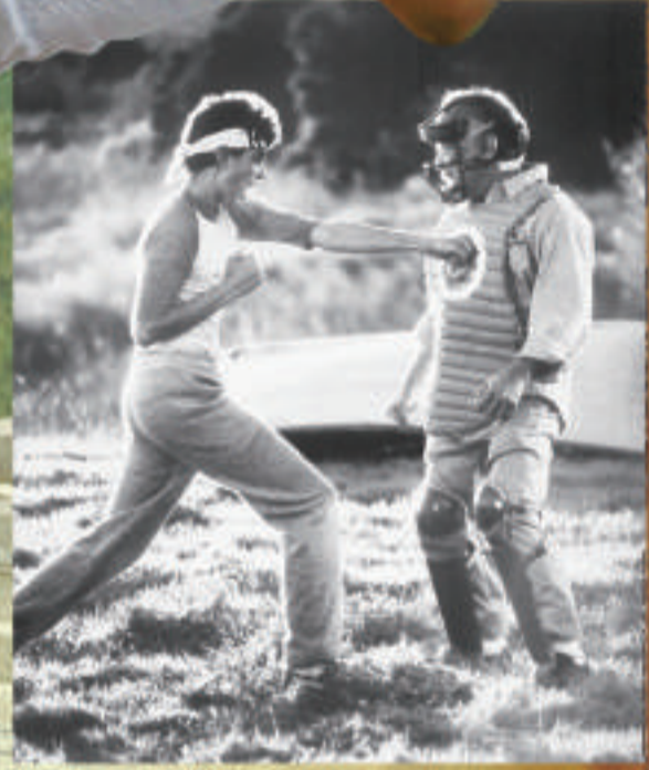
▲一九八四年的《龍威小子》風靡一時