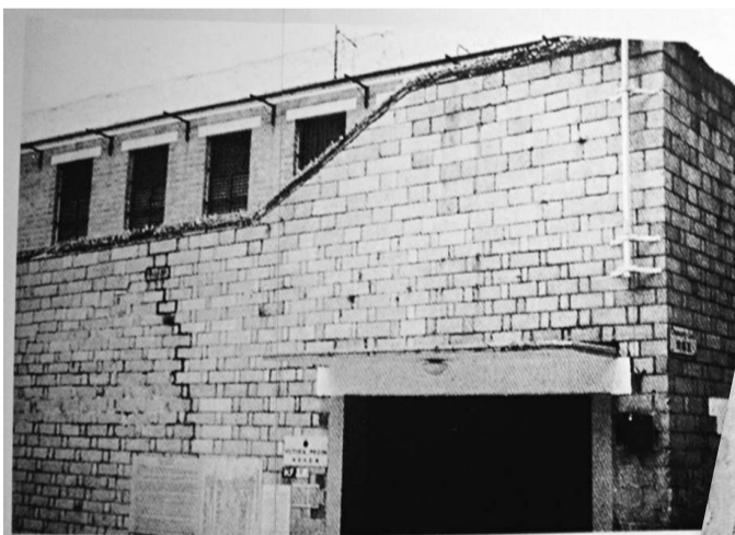
▲當年關押胡志明的奧卑利街十六號域多利監獄

胡志明在領導越南人民爭取民族獨立的鬥爭過程中，曾長期在中國進行革命活動，其中一九二四年至一九二七年在廣州和一九二九年移居至一九三三年在香港的革命活動，是其革命歷程中的重要階段。