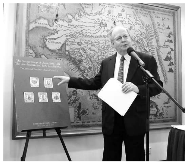
舒耐特介紹郵票背後的故事 本報攝