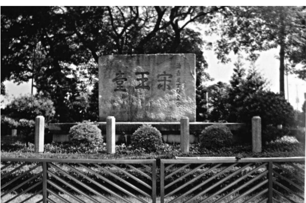
▲香港九龍宋王臺，胡志明主持召開越南共產黨成立會議的地點之一

中國與越南，山水相連，文化相通，理想相同，命運相關。二〇一〇年作為中越關係進程中具有重要意義的一年，兩國人民迎來建交六十周年紀念日，越南勞動黨主席、越南民主共和國主席胡志明誕辰一百二十周年，並迎來首個「中越友好年」。雙方共同舉辦政治、經濟、人文等涵蓋兩國關係方方面面的友好交流活動。其中，大型畫冊