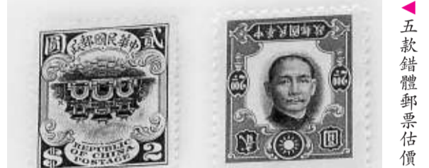
五款錯體郵票估價共三百萬元