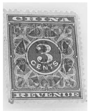
「綠衣紅娘」郵票估價八百萬元至一千萬元

上述拍賣將於七月三十一日及八月一日在香港柏寧酒店二十八樓松樹廳、樺樹廳舉行，拍賣預展則於七月二十九日、三十日上午十時至下午六時在柏寧酒店二十八樓樺樹廳舉行，詳情可登上該拍賣行網站 www.interasia-auctions.com。