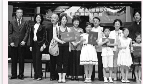
▲劉詩昆(左)與嘉賓及獲獎小朋友合影

【本報訊】實習記者劉輝輝報道：鋼琴家劉詩昆主辦的「二〇一〇年香港少年兒童鋼琴大賽閉幕式暨頒獎典禮音樂會」日前在香港文化中心音樂廳舉行。近千名來自內地和香港的兒童獲獎。劉詩昆表示，「重要在鼓勵他們繼續學習音樂。」